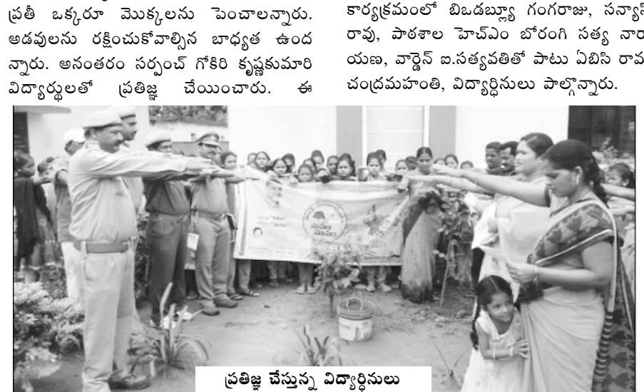
ప్రతిజ్ఞ చేస్తున్న విద్యార్థినులు