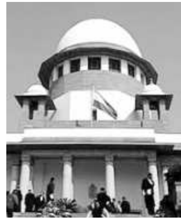
ఉన్నపుడు, ఆ మహిళతో లైంగిక సంభోగం జరపడం నేరమని ఈ సెక్షన్ వివరించింది.

న్యూఢిల్లీ : అత్యాచారాన్ని నేరంగా పరిగణించే పట్టణంపై సంచలన విచారణ జరిపేందుకు సుప్రీంకోర్టు తీరస్కరించింది. భారతీయ శిక్షా న్యూతిల్ని సెక్షన్ 375లో మహిళలపై అత్యాచారాన్ని మాత్రమే ప్రస్తావించారని, పురుషులపైనా, నపుంసకులపైనా జరిగే అత్యాచారాల గురించి ప్రస్తావించలేదని పిటిషన్ల ఆరోపించారు. ఈ నిబంధనలను సవరించి, స్త్రీ, పురుష, నపుంస కులపై జరిగే అత్యాచారాలపై సమానంగా విచారణ జరిగేలా చర్యలు తీసుకోవాలని పిటిషన్ల కోరారు. దీనిపై సుప్రీంకోర్టు స్పందిస్తూ ఈ విషయం పూర్తిగా పార్లమెంటు పరిధిలోనే ఉందని తెలిపింది. క్రిమినల్ జస్టిస్ సెక్షన్ 375లోని అధికరణలు 14, 15, 21లను ఉల్లంఘిస్తున్నట్లు ప్రభుత్వేతర సంస్థ దాఖలు చేసిన ఈ పిటిషన్లపై విచారణ జరిపేందుకు భారత ప్రధాన న్యాయమూర్తి జస్టిస్ రంజన్ గోగోయ్, జస్టిస్ సంజయ్ కిషన్ కల్ ధర్మావంశం తీరస్కరించినది.