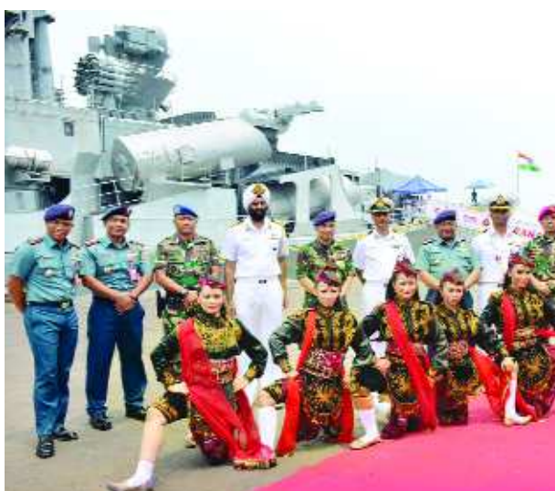
భారత నాకొదళం ఇండో విడియన్ నావికా దళముల సురబయలులో జరిగే దైవార్చిక యుద్ధ విన్యాసాలు సముద్ర శక్తిలో భాగంగా ఐఎన్ఎస్ రాజా పాల్గొన్న సిబ్బంది. ఇది 18 నవంబర్ వరకు ఈ విన్యాసాలు జరగనున్నాయి