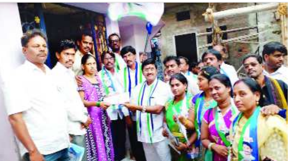
ఒట్టే టౌన్ : మహిళలమంత్రి ఏకాంతిపై నడుస్తాం.. ఒట్టేసి చెబుతున్నాం.. జగన్ నన్ను గెలిపింపి రాజస్థాన్ రాజ్యం తీసుకువచ్చేందుకు కృషి చేస్తామని దక్షిణ నియోజకవర్గంలో ఉన్న ప్రతి మహిళా ముక్తకంఠం విలుగిత్రి ప్రతిజ్ఞ చేశారు. విశాఖ దక్షిణ నియోజకవర్గం 24వ వార్డులో బాత్ నెం.లు 127, 128, 129, 130, 131 గల విరియాలలో ఫోషా ఆసుపత్రి