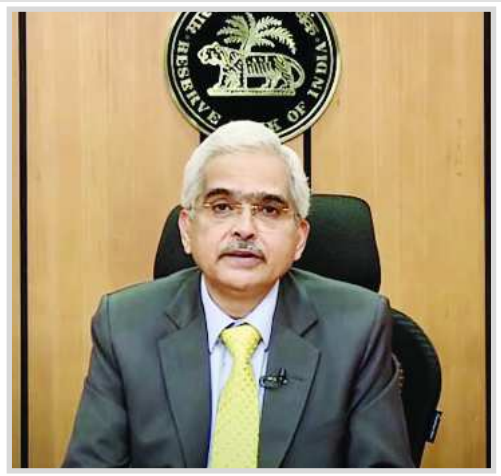
కొనసాగింపునకే ఆర్బీఐ మొగ్గుచూపింది. రిజర్వ్ ద్రవ్యోల్పాణి 4 శాతానికి పరిమితం చేయాలన్న ప్రభుత్వ లక్ష్యానికి అనుగుణంగా ఆర్బీఐ నిర్ణయాలు తీసుకుంది. ప్రస్తుత ఆర్థిక సంవత్సరంలో జరుగుతున్న మొదటి ద్రవ్యపరపతి విధాన

ముంబయి : కీలక వడ్డీరేట్లలో ఎలాంటి మార్పు లేదని రిజర్వ్ బ్యాంక్ ఆఫ్ ఇండియా (ఆర్బీఐ) ప్రకటించింది. దీంతో ప్రస్తుతం ఉన్న 4 శాతం రెపోరేటు, 3.3 శాతం రివర్స్ రెపోరేటు వరుసగా ఐదోసారి యధాతథంగా కొనసాగి నున్నాయి. 2021-22లో జిడిపీ వృద్ధి 10.5 శాతంగా ఉంటుందని ఆర్బీఐ అంచనా వేసింది. ఆర్బీఐ గవర్నరు శక్తికాంత్ దాస్ నేతృత్వంలోని పరపతి విధాన కమిటీ (ఎంపీసీ) మూడు రోజుల సమావేశం సోమవారం ప్రారంభమైన విషయం తెలిసింది. కమిటీ నిర్ణయాలను శక్తికాంత్ దాస్ బుధవారం ప్రకటించారు. సర్దుబాటు విధాన వైఖరికే మొగ్గు.. కరోనా కేసుల సంఖ్య పెరుగుతుండటం, కొన్ని చోట్ల లాక్డౌన్ల ఆంక్షల విధింపు నేపథ్యంలో ప్రస్తుతమున్న సర్దుబాటు విధాన వైఖరి