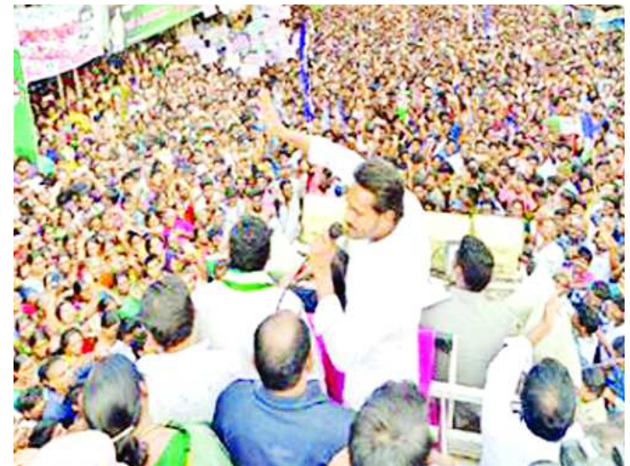
గుమ్మి గూడారు. చర్యలకు పిలిచి అవమానించారని.. సమ్మెను మరింత తీవ్రం చేస్తున్నారు.

నాయా బ్రాహ్మణులు అక్కడున్న సమయంలోనే సీఎం కాన్వాయ్ వచ్చింది. జనాల గుంపును చూసి చంద్రబాబు.. కారు ఆపి దిగి వచ్చారు. భద్రతా సిబ్బంది వారిని అడ్డుకోబోగా సీఎం ఆహ్వానించు బిక్కెట్లకు రూ.25 ఇస్తామని చెప్పారు. అయినా వాళ్లు వెనక్కు తగ్గలేదు. గౌరవ వేతనం, పెన్షన్ ఇవ్వాలని అడిగారు. చంద్రబాబు మాత్రం ససేమిరా అన్నారు. కొందరు నాయా బ్రాహ్మణులు వాగ్దానికి దిగగా.. వారిపై సీఎం ఆగ్రహం వ్యక్తం చేశారు. న్యాయం ఉంటే వెదుక్కుంటూ వస్తా.. ఏం చేస్తారో చేసుకోండి అంటూ వెళ్లిపోయారు. ఇవాళ చంద్రబాబు వ్యాఖ్యలపై జగన్ స్పందించారు.