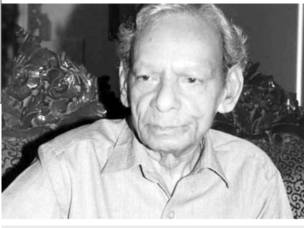
డా. నేరెళ్ళ (పైల్ షోట్)