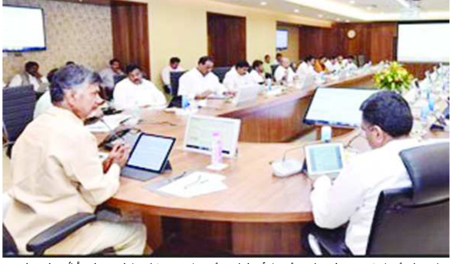
అమరావతి: ఏపీ మంత్రివర్గం సచివాలయంలో సమావేశమైంది. ముఖ్యమంత్రి చంద్రబాబు అధ్యక్షతన కేబినెట్ ఛీఫ్ కొనసాగుతోంది. ఈ సమావేశంలో ప్రధానంగా నిరుద్యోగ భృతి విధివిధానాల ఖరారుపై చర్చించనున్నారు. అలాగే పరిశ్రమలకు భూకేటాయింపులు, అగ్రిగోల్డ్ అంశంపై చర్చించనున్నారు. తరువాయి 2లో..