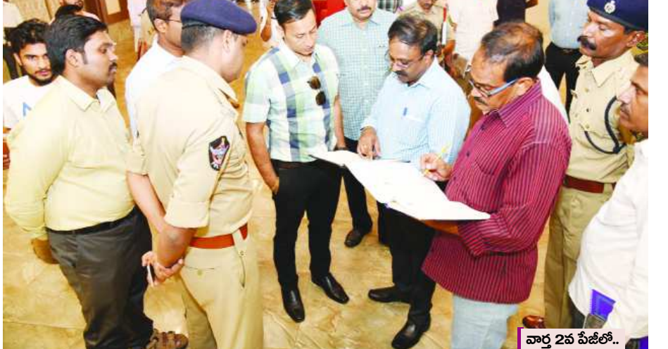
వార్త 2వ పేజీలో..