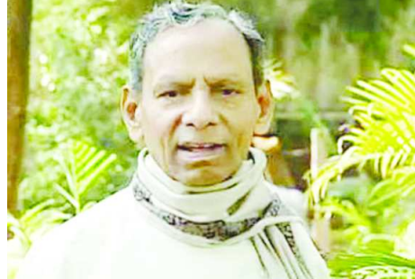
వార్త 2వ పేజీలో..

ఐ.రా.స.లో ప్రదర్శన ఇచ్చిన ఏకైక తెలుగు కళాకారుడు