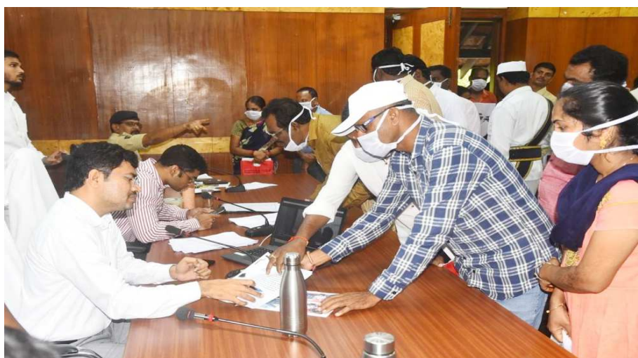
విశాఖపట్నం, సెప్టెంబర్ 04 :- జగనన్నకు చెబుదాం (స్పందన) అర్జీలపై ప్రత్యేక దృష్టి సారించి, సత్వరమే పరిష్కరించాలని జిల్లా కలెక్టర్ డా.ఏ. మల్లికార్జున అధికారులను ఆదేశించారు. సోమవారం ఉదయం కలెక్టరు కార్యాలయ సమావేశ

మందిరంలో ఏర్పాటుచేసిన జగనన్నకు చెబుదాం( స్పందన) కార్యక్రమంలో జిల్లా కలెక్టర్ ప్రజల నుండి అర్జీలను స్వీకరించారు. ఈ సందర్భంగా కలెక్టర్ మాట్లాడుతూ జగనన్నకి చెబుదాం (స్పందన) కార్యక్రమంలో ప్రజల నుండి వచ్చే అర్జీలను నిబంధనల ప్రకారం నిర్ణీత సమయంలోగా పరిష్కరించాలని అధికారులను ఆదేశించారు. ప్రజల నుండి విజ్ఞప్తులు వచ్చినపుడు సకాలంలో విచారణ జరిపి తగిన చర్యలు తీసుకోవాలని సూచించారు. జగనన్నకి చెబుదాం (స్పందన) కార్యక్రమం లో వచ్చే ప్రజా సమస్యలకు అధిక ప్రాధాన్యత ఇచ్చి అవసరమైతే వ్యక్తిగతంగా తనిఖీ చేసి సంతృప్తికరంగా పరిష్కార మార్గం చూపించాలన్నారు. పెండింగ్ బియాండ్ ఎస్ఎల్ఐ, రీఓపెనింగ్ లేకుండా అర్జీదారుడు సంతృప్తి చెందేలా అర్జీలను పరిష్కరించాలన్నారు. సోమవారం జగనన్నకు చెబుదాం కార్యక్రమంలో 172 విజ్ఞప్తులు అందాయి. ఈ కార్యక్రమంలో జాయింట్ కలెక్టర్ కే.ఎస్. విశ్వనాథన్, జిల్లా రెవిన్యూ అధికారి ఎస్. శ్రీనివాస మూర్తి , అర్జీ ఓ హాస్పెస్ సాబాబ్ , పోలీస్ అధికారులు , మున్సిపల్ అధికారులు జిల్లా అధికారులు పాల్గొన్నారు