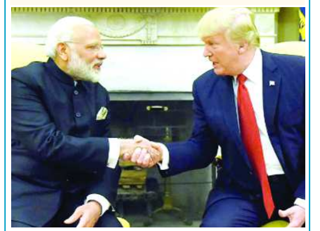
వాషింగ్టన్: ఉత్తర కొరియా ప్రపంచ ముప్పుగా పరిణమించిందని ఆ దేశంపై ఒత్తిడి చేసేందుకు తరువాయి 2లో

భారత్ సాయం కోరిన అమెరికా అణుక్షిపణుల ప్రయోగాలను అడ్డుకోండి అమెరికా అధ్యక్షుడు డోనాల్డ్ ట్రంప్