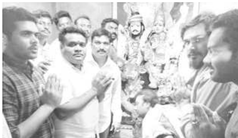
కుండా చర్యలు చేపట్టారు. పోలీసులు ట్రాఫిక్ ను క్రమబద్ధీకరించారు. మెయిన్ రోడ్ అధ్యాత్మిక శోభ సంతరించుకుంది. ఏర్పాటు చేసిన సెట్టింగులను తిలకించేందుకు పెద్ద ఎత్తున ప్రజలు తరలివస్తుండడంతో ట్రాఫిక్ ఇబ్బందిగా మారింది. ఏదీఏమైన గౌరీ పరమేశ్వరుల ఉత్సవం అత్యంత వైభవంగా జరిగింది.