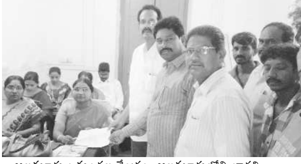
అలమూరు : మండల కేంద్రం, అలమూరులోని భారతి రైసుమిల్లులో ప్రాణాంతకమైన ప్లాస్టిక్ ఫ్యాక్టరీ నిర్మాణం ప్రయత్నాన్ని నిలుపుదల చేయాలని కోరుతూ సోమవారం స్థానిక తహశీల్దార్ వారి కార్యాలయంలో నిర్వహించిన