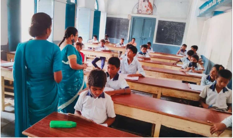
ఉపాధ్యాయులు ద్వారా తెలిపాలని చెప్పారు. అనంతరం పరీక్ష జరిగిన విధానంను, ప్రక్రియను పరిశీలించారు.