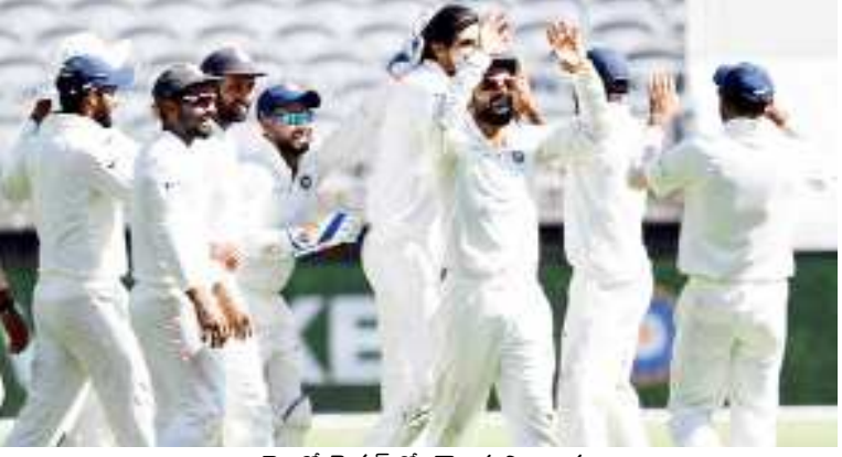
రెండో సెషన్ లో బౌలర్ల విజృంభణ భోజన విరామం తర్వాత ఫించ్, హ్యూరిస్ చెలరేగారు. ముందు హ్యూరిస్ రెగిస్టర్ లో తొలి అర్ధశతకం బాడేశాడు. వేగంగా పరుగులు చేశాడు. ఇదే క్రమంలో ఫించ్ సైతం 50 పరుగుల మైలూరాయి చేరుకున్నాడు.

పెర్ర: ఆస్ట్రేలియా కోరుకున్నట్లే ఆడింది. పట్టుదలగా నిలిచింది. అత్యంత బౌన్సి, పేస్ పిచ్ ను తయారు చేయించుకున్న ఆ జట్టుకు టాస్ రూపంలో అద్భుతమూ వరించింది. బ్యాట్స్ మెన్ రాణించారు. తొలి సెషన్ లో ఫించ్, హ్యూరిస్ దుముర్రేపారు. రెండో సెషన్ లో టీమిండియా బౌలర్లు విజృంభించారు. మూడో సెషన్ లో వికెట్లు పడ్డా కంగారూలదే అధిపత్యం. రెండో టెస్టు తొలిరోజు ఆట ముగిసే సరికి అతిథ్య జట్టు 277/6తో పటిష్ఠ స్థితిలో నిలిచింది. మన బౌలర్లు క్రమశిక్షణతో బంతులు విసిరారు. తొలి సెషన్: పట్టుదలగా హ్యూరిస్, ఫించ్ టాస్ గెలిచిన బ్యాటింగ్ అరంభించిన ఆసీస్ కు ఓపెనర్లు మార్కస్ హ్యూరిస్ (70; 141 బంతుల్లో 10న4), ఆరోన్ ఫించ్ (50; 105 బంతుల్లో 6న4) అద్భుత అరంభం అందించారు. తొలి వికెట్ కు 112 వరుగుల భాగస్వామ్యం అందించారు. పచ్చికతో జీవం ఉట్టిపడుతున్న పిచ్ పై తొలుత నిలిచారు. అచిరుకాది ఆడుతూ అందివచ్చిన బంతుల్ని బౌండరీకి తరలించారు. టీమిండియా బౌలర్లు ఎంత ప్రయత్నించినా వికెట్ ఇవ్వలేదు. దీంతో భోజన విరామానికి ఆ జట్టు 66/0తో నిలిచింది.