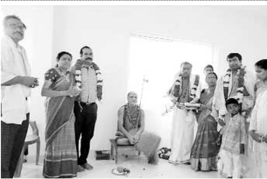
ప్రకాశం జిల్లా మార్కాపురం లో యస్. ఎస్ విద్యాసంస్థల నూతన కళాశాల ప్రారంభోత్సవం గాంచిన విశాఖ శ్రీశారదాపీఠాధిపతులు స్వరూపానందేంద్రనరసేత్రి మహాస్వామివారు.