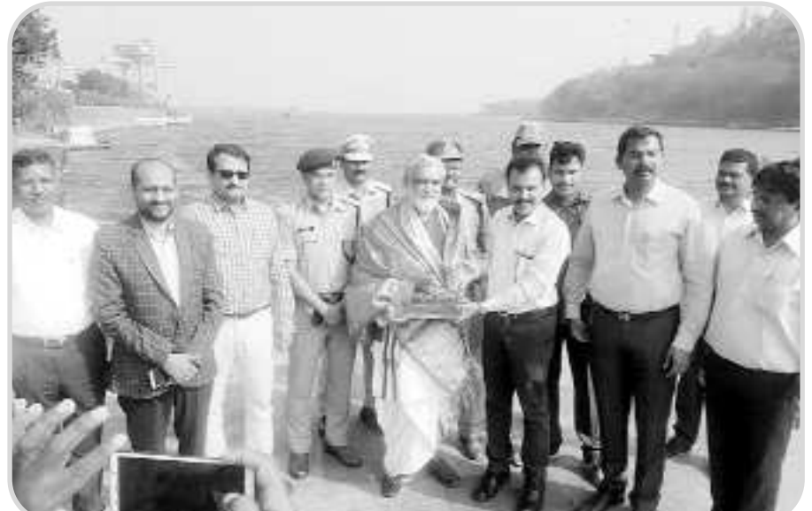
కేంద్ర ఆరోగ్య మరియు కుటుంబ సంక్షేమ శాఖ సహాయ మంత్రి అశ్వని కుమార్ చౌవే విశాఖ పట్నం పోర్ట్ ట్రస్టు ను శుక్రవారం సందర్శించారు. పోర్ట్ డెవలప్ మెంట్ కమిటీ కుంభరవిభామ ఆధ్వర్యంలో జరుగుతుంది. ఈ టోర్నీ మొదటి లో 100 టీమ్ లు పాల్గొంటున్నాయి. మొదటి బహుమతి 50,000, రెండవ బహుమతి 25,000 మూడవ బహుమతి 15,000 రూపాయలు ప్రకటిస్తారు.

విశాఖపట్నం : మండల కేంద్రంలో గల ఎస్.టి.ఆర్ మైదానంలో నేటి నుండి వాలిబాల్ మెగా టోర్నీ మొదటి జరుగుతుంది. నియోజక వర్గ వై.యస్.ఆర్ రాష్ట్ర వర్సింగ్ కమిటీ కుంభరవిభామ ఆధ్వర్యంలో జరుగుతుంది. ఈ టోర్నీ మొదటి లో 100 టీమ్ లు పాల్గొంటున్నాయి. మొదటి బహుమతి 50,000, రెండవ బహుమతి 25,000 మూడవ బహుమతి 15,000 రూపాయలు ప్రకటిస్తారు.