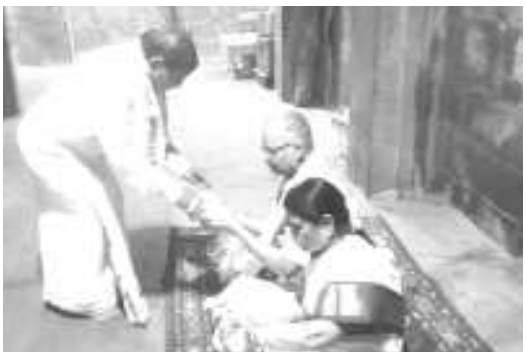
వారికి స్వామివారి చిత్రపటం ప్రసాదం అందజేశారు.