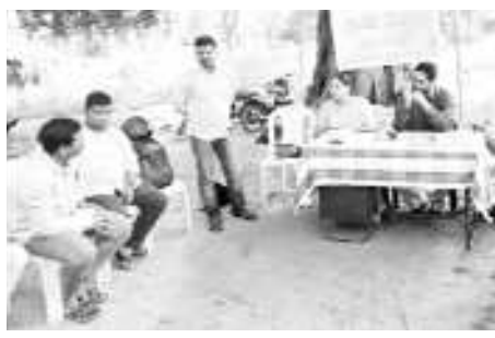
కొయ్యూరు : పేద గిరిజన కుటుంబాలు ఆదుకోవడం కోసం అనేక అభివృద్ధి పథకాలు

రోడ్డు నుంచి మరైపోయి వయా చిట్టించారు, గడబపోయి మీదుగా వెళ్లే రహదారిని అభివృద్ధి చేయాలని కోరారు.