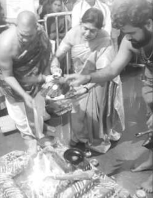
బురుజుపేట: ఉత్తరాంధ్ర ప్రజల కొంగుబంగారమైన శ్రీ కవక మహాలక్ష్మి అమ్మవారి దేవస్థానంలో మార్గశిర మాసోత్సవాలు ఘనంగా నిర్వహించబడుతున్నాయి.