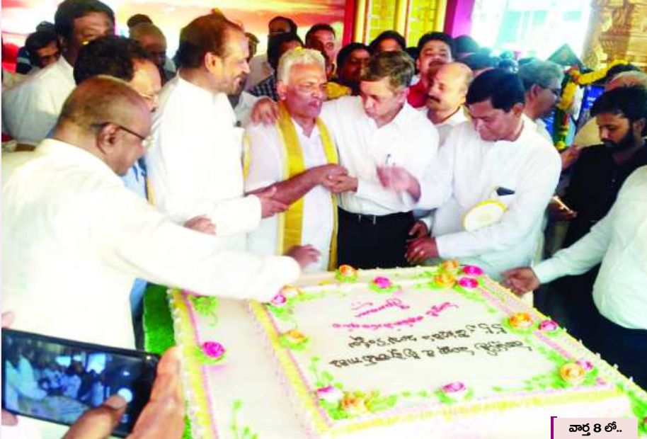
వారం 8 తో... తరువాయి 2లో