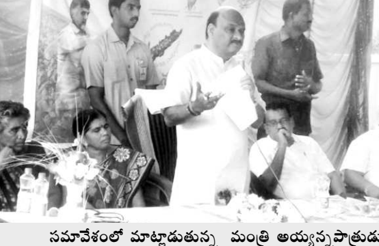
సమావేశంలో మాట్లాడుతున్న మంత్రి అయ్యన్నపాత్రుడు

గొలుగొండ : నాలుగేళ్ల అభివృద్ధి ప్రజలకు తెలియజేయాలనే ముఖ్య ఉద్దేశ్యంతోనే నవనిర్మాణదీక్ష కార్యక్రమాన్ని చేపట్టడం జరిగిందని రాష్ట్ర భవనాల శాఖా మంత్రియల వింతకాయల అయ్యన్నపాత్రుడు అన్నారు. మండలంలో ఏటిగైరంపెట గ్రామంలో బుధవారం జరిగిన నవనిర్మాణదీక్ష కార్యక్రమంలో ఆయన పాల్గొన్నారు. ఈ సందర్భంగా ఆయన మాట్లాడుతూ నవనిర్మాణ దీక్ష కార్యక్రమం వల్ల గ్రామాల్లో జరుగుతున్న ప్రగతిపై అధికారుల సమకాలీన సమీక్ష చేసుకునే అవకాశం ఉంటుందన్నారు. అజ్ఞాతానందం పంచాయతీలో రెండు కోట్ల