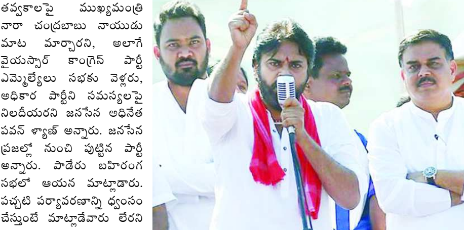
పాడేరు: బాక్సులపై తవ్వకాలపై ముఖ్యమంత్రి నారా చంద్రబాబు నాయుడు మాట మార్చారని, అలాగే వైయస్సార్ కాంగ్రెస్ పార్టీ ఎమ్మెల్యేలు సభకు వెళ్లరు, అధికార పార్టీని సమస్యలపై నిలదీయరని జనసేన అధినేత పవన్ కల్యాణ్ అన్నారు. జనసేన ప్రజల్లో నుంచి పుట్టిన పార్టీ అన్నారు. పాడేరు బహిరంగ సభలో ఆయన మాట్లాడారు. పచ్చటి పర్యావరణాన్ని ధ్వంసం చేస్తుంటే మాట్లాడేవారు లేరని అన్నారు. చంద్రబాబుకు ఆ విషయం ముందే చెప్పా. చంద్రబాబుకు అనుభవం ఉందని గత ఎన్నికల్లో మద్దతిచ్చామని, కానీ ఆయన