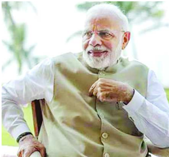
వయసులో రెండు సంవత్సరాల పాటు హిమాలయాలకు వెళ్లినట్లు తెలిపారు. హిమాలయాల నుంచి వచ్చిన తర్వాత ఇతరులకు సేవ చేసేందుకు నా జీవితాన్ని ఉపయోగించాలనుకున్నాను. ఆ తరువాయి 2లో..

దిల్లీ: ప్రధాని నరేంద్ర మోదీ తాను యువకుడిగా ఉన్నప్పుడు చేసిన పనుల గురించి కొన్ని ఆసక్తికర విషయాలు వెల్లడించారు. హ్యూమన్స్ ఆఫ్ బాంబే అనే ఫేస్ బుక్ పేజీకి ఇచ్చిన ఇంటర్వ్యూలో పలు అంశాలను గుర్తు తెచ్చుకున్నారు. తాను యువకుడిగా ఉన్నప్పుడు ఏటా దీపావళి సమయంలో ఐదు రోజుల పాటు అడవిలోకి వెళ్లిపోయేవాడినని, ఎవ్వరూ లేని చోటుకు వెళ్లి ప్రశాంతంగా గడిపేవాడినని చెప్పారు. దీనికోసం స్వచ్ఛమైన నీరు ఉన్న చోటును ఎంచుకునేవాడినని, సరిపడా ఆహారం తీసుకెళ్లేవాడినని చెప్పుకొచ్చారు. రేడియో, దినపత్రికలు ఏమీ లేకుండా గడిపేవాడినన్నారు. అది తనను తాను మెరుగుపరుచుకోవడానికి ఎంతో ఉపయోగపడిందన్నారు. ఆప్టో టీవీ, ఇంటర్నెట్ లేవని చెప్పారు. బిజీ జీవితాలకు దూరంగా అలా గడపడం చాలా హాయిగా అనిపించేదని చెప్పారు. రోజువారీ హడావుడి జీవితాలకు విరామం ఇచ్చి.. కొంత సమయం మీతో మీరు గడిపితే అది ఎంతో ఉపయోగపడుతుందని మోదీ యువతకు సలహా ఇచ్చారు. అప్పుడే నిజమైన ప్రపంచంలో జీవించడం మొదలుపెడతారన్నారు. అప్పుడు మీపై మీకు నమ్మకం పెరుగుతుందని, ఇతరులు మీ గురించి ఏం చెప్పినా ఆర్డర్ చేసుకోగలగుతారని సూచించారు. మీకు మీరే ప్రత్యేకమని, ఎవరో ఏదో చేస్తారని ఎదురుచూడద్దని పేర్కొన్నారు. మోదీ ఈ ఇంటర్వ్యూలో తన బాల్యం గురించి మాట్లాడారు. పదిహేడేళ్ల