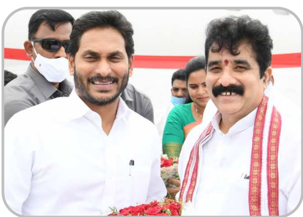
చోడవరం ఎమ్మెల్యే కరణం ధర్మశ్రీ