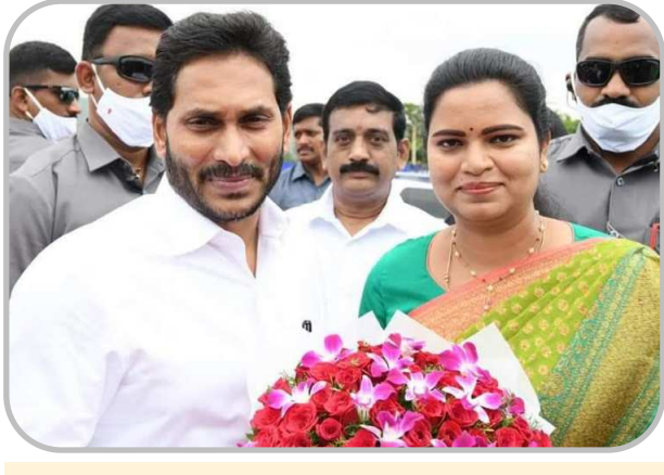
జిల్లా ఇన్చార్జి మంత్రి విడుదల రవి