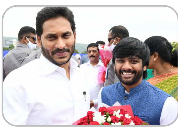
పెందుర్తి ఎమ్మెల్యే అధీష్ఠాణ్