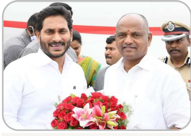
ఉపముఖ్యమంత్రి బూడి ముత్యలనాయుడు