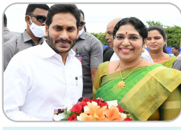
ఎమ్మెల్సీ వరుడు కళ్యాణి