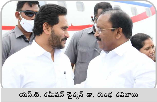
యస్.టి. కమిషన్ చైర్మన్ డా. కుంభ రవిబాబు