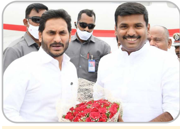
ఐటీ & భారీ పరిశ్రమల శాఖ మంత్రి గుడివాడ అమర్నాథ్