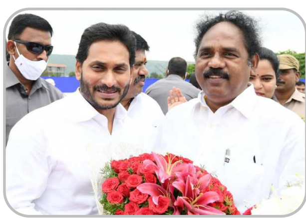
ఎమ్మెల్యే వాసుపల్లి గణేష్కుమార్