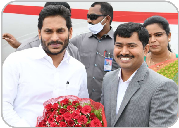
జిల్లా కలెక్టర్ ఎన్. మల్లికార్జున