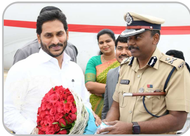
నగర పోలీస్ కమిషనర్ శ్రీకాంత్