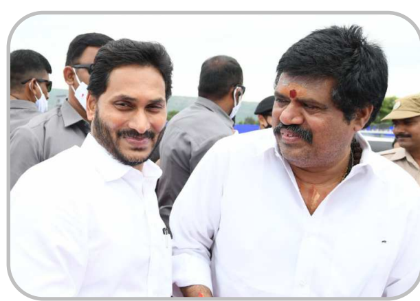
భీమునిపట్నం ఎమ్మెల్యే అవంతి శ్రీనివాస్