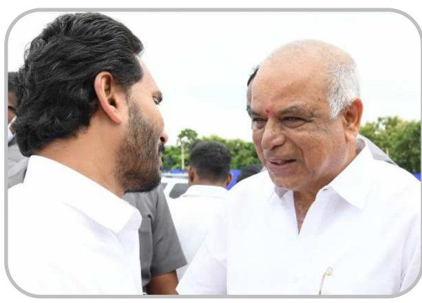
యలమంచిలి ఎమ్మెల్యే కన్నబాబు రాజు