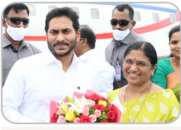
అనకాపల్లి యం.పి. బి.సత్యవతి