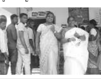
మండలంలో 27 పంచాయతీల పరిధిలో 65 పోలింగ్ కేంద్రాలలో ఓటర్లు తమ ఓటు హక్కును వినియోగించేందుకు బారులు తీరారు. ఎన్నడూ

యలమంచిలిలో... సార్వత్రిక ఎన్నికల సందర్భంగా గురువారం జరిగిన పోలింగ్ కు ఓటర్లు ఉదయం 7 గంటల నుంచి పాల్గొన్నారు. దీంతో పోలింగ్ కేంద్రాలు ఓటర్లతో కిక్కిరిసిపోయాయి. అధిక శాతం మంది ఉదయం నుంచి 12 గంటల లోపు ఓటు హక్కు వినియోగించుకున్నారు. ఎటువంటి అల్లర్లు, ఘర్షణలు చోటుచేసుకోకుండా పోలీసులు చర్యలు చేపట్టారు.