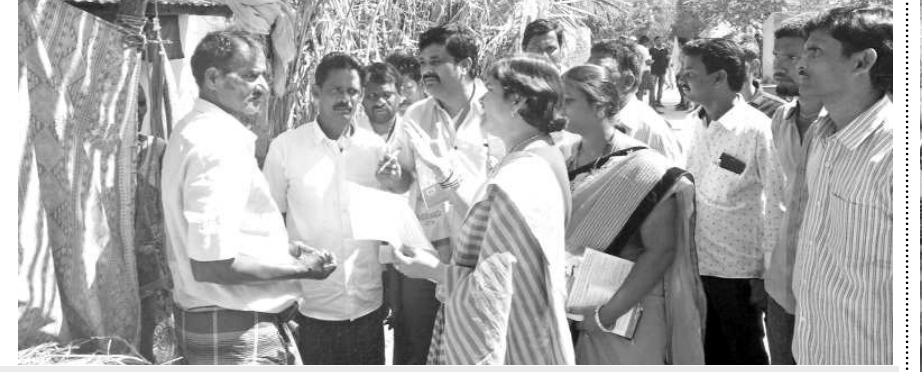
దళిత వాడల్లో పర్యటిస్తున్న ఎంపి

నర్సపట్నం : దళితుల అభివృద్ధి కోసమే చంద్రన్న ముందడుగు కార్యక్రమం ప్రవేశ పెట్టడం జరిగిందని ఎంపి సుకల రమణమ్మ అన్నారు. చంద్రన్న ముందడుగు దళితశేజం - తెలుగుదేశం కార్యక్రమంలో భాగంగా మండలంలోని అమలాపురం పంచాయతీలో నిర్వహించారు. గ్రామంలో ఉన్న ఎన్నో కాలనీ పర్కెటింగ్ చారు. ఈ సందర్భంగా ఎంపి సుకల రమణమ్మ ప్రతి ఇంటికీ వెళ్లి వారికి ప్రభుత్వ పథకాలు