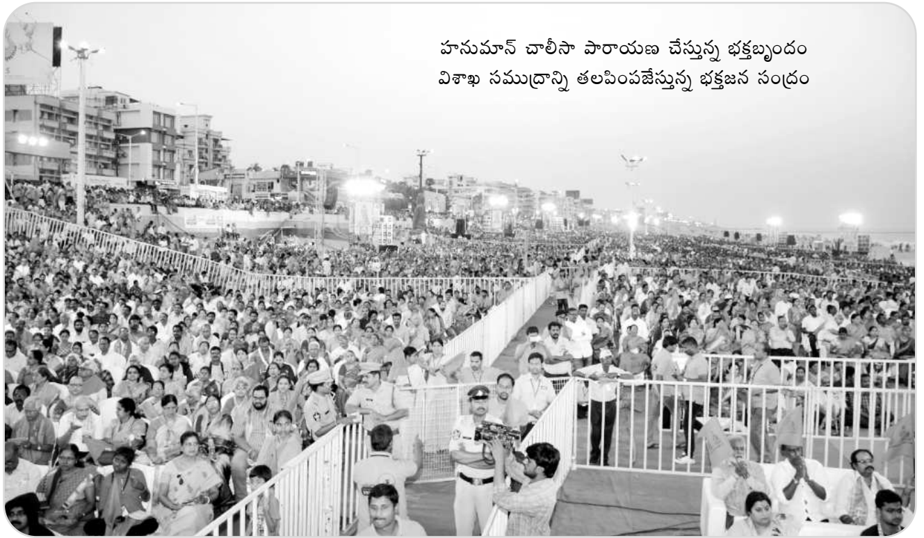
హనుమాన్ చాలీసా పారాయణ చేస్తున్న భక్తబృందం విశాఖ సముద్రాన్ని తలపింపజేస్తున్న భక్తజన సంద్రం