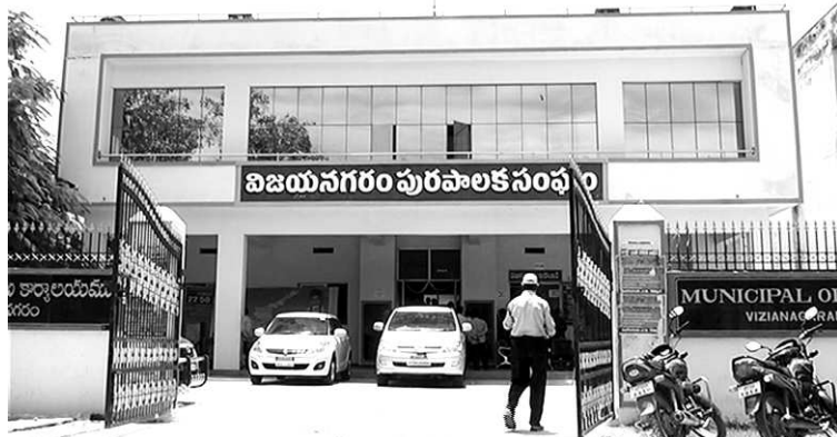
సిబ్బందితో కమీషనర్ కమ్యూనికేషన్:

ఇటీవల సిబ్బంది సైతం కమీషనర్పై తిరుగుబాటులా ఎగరేసిండుకు నిర్దవదినట్లు సమాచారం. అడుగుడుగునా ప్రభుత్వం, ఏ పనిచేసినా చేతత్తిచూపిస్తున్న కమీషనర్ తీరుపై అటు అధికారుల్లో, ఇటు సిబ్బందిలో అసహనం అంతకంతకూ ఎక్కువవుతోంది. పరిస్థితి ఇలాగే కొనసాగితే తమ సేవలకి గుర్తింపు లేకుండా పోతుందని సిబ్బంది వాపోతున్నారు. నియమనిబంధనల విషయంలో కూడా కమీషనర్ భిన్నవాదనని వినిపించడం సిబ్బందికి దిక్కుతోచని పరిస్థితి కల్పిస్తోంది. సిబ్బంది తయారుచేసే ప్రతి దస్త్రంపై కమీషనర్ ఏదోకొ కొర్ర వేయడం, దానిపై సిబ్బందిని పదిమందిలో నిలదీసి కడిగేయడం వారు జిద్దుచుకోలేకపోతున్నారు. అయినదానికి కానీదానికి కమ్యూనికేషన్ కమీషనర్తో అమీతుమీ తేల్చుకుంటూనే ఉండ్యాలందరూ నిర్దవదనుకున్నట్టు భోగట్టా. ఇందుకు అవసరమైతే వర్క్ టూ రూల్ చేపట్టాలని ఒక నిర్దయానికి వచ్చినట్టు విశ్వసనీయ సమాచారం. నిన్నటివరకూ పురపాలక సంఘం నాలుగుగోడల మధ్య నలుగుతున్న ఈ వ్యవహారం రెండు మూడు రోజుల్లో రచ్చకెక్కిన అశ్చర్యపడతినై అవసరం లేదు. అదేం విచిత్రమో కానీ, ఏ కమీషనర్ వచ్చినా అధికార పార్టీకి అచ్చిరావటం లేదు. కమీషనర్ గా రవీంద్ర్రావు విజయనగరానికి రప్పించబడంలో అధికారవర్గానికి చెందిన వాయిలకు కృషి తెరవెనుక వుంది. అయితే ప్రస్తుతం వచ్చిన కమీషనర్ పాలకవర్గంలో సామరస్యంగానే ఉన్నారు. పాలకవర్గానికి, మున్సిపల్ సిబ్బంది కలిసిరావటంలేదు. దాంతో కమీషనర్ను అడ్డుపెట్టుకున్న పాలకవర్గం వచ్చింది గడుపుతోందని కొందరి వాదన.నా మాటే వినటం లేదని కమీషనర్ ముందు చైర్మన్లనై తెగ వాపోతున్నారు. మీరోస్తై బాగుంటుందని భావించాం. ఇక మీ ఇష్టం అన్నట్టు చూసేచూడనట్టు ఉన్నారు.