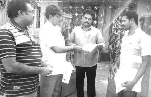
చోడవరం : జీవిత భీమాపై భవిష్యత్తును హాయిగా, ఆనందముగా గడపవచ్చునని స్థానిక జీవిత భీమా శాఖ లాంచి