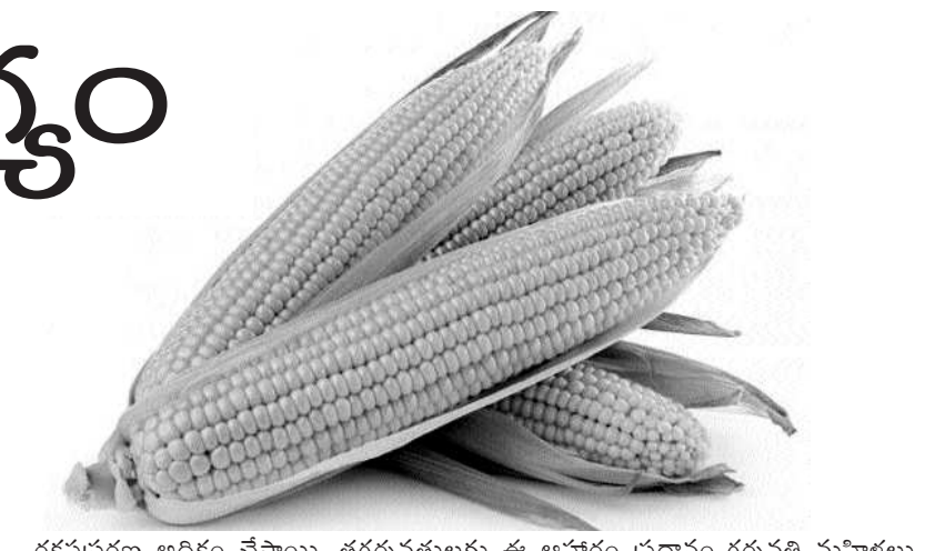
రక్తప్రసారణ అధికం చేస్తాయి. తగ్గవతులకు ఈ ఆహారం ప్రధానం-గర్భవతి మహిళలు తమ ఆహారంలో మొక్కజొన్న తప్పక కలిగి ఉండాలి. దీనిలో వుండే ఫోలిక్ యాసిడ్ గర్భవతి మహిళలకు మంచి ప్రయోజనం చేకూరుస్తుంది. కాళ్ళు చేతులు, వారికి వాపురాకుండా చేస్తాయి. ఫోలిక్ యాసిడ్ తగ్గితే అది బేబీ బరువును తక్కువ చేస్తుంది. కానుక మొక్కజొన్న తింటే, తల్లికి, బిడ్డకు కూడా ప్రయోజనమే.కనుక మీ ఆహారంలో తగినంత మొక్కజొన్న ఆహారం చేర్చి తినండి. దానివలన వచ్చే వివిధ ఆరోగ్య ప్రయోజనాలను పొందండి. వివిధ రోగాలను తగ్గించుకోండి. ఆరోగ్యంగా ఉండండి.

గింజలలో మినరల్స్ అధికం. మెగ్నీషియం, ఐరన్, కాపర్, ఫాస్ఫరస్ వంటివి కూడా వీటిలో వుంది ఎముకలు గట్టిపడేలా చేస్తాయి. మీ ఎముకల విరుగుట అరికట్టటమేకాక, మీరు పెద్దవారయ్యే కొద్ది కిడ్నీలను కూడా ఆరోగ్యంగా వుంచుతాయి. చర్మ సురక్షణ- మొక్కజొన్నలో యాంటీ ఆక్సిడెంటు వుంటాయి. ఇవి చర్మాన్ని కాంతివంతంగా వుంచి ఎప్పుటికి చిన్నవారుగా కనపడేలా చేస్తాయి. మొక్కజొన్న గింజలు తినటమే కాక, ఈ విత్తనాల నూనె కనుక చర్మానికి రాస్తే, దీనిలో వుండే లినోలైక్ యాసిడ్ చర్మముంటలను, లేదా ర్యాపిలను కూడా తగ్గిస్తుంది. రక్తహీనతను అరికడతాయి. రక్తహీనత అంటే మీలోని ఎర్ర రక్తకణాల సంఖ్య ఐరన్ లేకపోవడం వలన గణనీయంగా పడిపోతుంది. మరి మీరు తినే స్టేట్ మొక్కజొన్న విటమిన్ మరియు ఫోలిక్ యాసిడ్లు కలిగి మీలో రక్తహీనత లేకుండా చేస్తుంది. కొల్సెస్టరాల్ నివారణ చేస్తాయి. శరీరంలో లిపిడ్ కొల్సెస్టరాల్ ను తయారు చేస్తుంది. రెండు రకాల కొల్సెస్టరాల్ తయారువుతుంది. అవి హైడ్రోఫిల్ మరియు చెడు కొల్సెస్టరాల్ అయిన ఎల్డెవిల్. నేటి రోజులలో కొద్ది అధికంగా ఉండే ఆహారాలు చెడు కొల్సెస్టరాల్ ను పెంచి గుండెను బలహీనం చేసి గుండె సంబంధిత వ్యాధులు కలిగిస్తున్నాయి. తీసి మొక్కజొన్నలో ఉండే విటమిన్ సి, కేరోటియాంథు మరియు మరూ ప్లేవినియాంథు మీ గుండెను చెడు కొల్సెస్టరాల్ నుండి కాపాడుతాయి. శరీరంలో