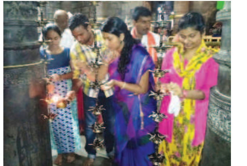
వ్యడం జరుగుతుందని ఆయన చెప్పారు. ఈ అవకాశాన్ని భక్తులంతా సద్వినియోగం చేసుకుని సింహగిరిశుని కరుణకు పాత్రులు కావాలని ఆయన పిలుపునిచ్చారు.