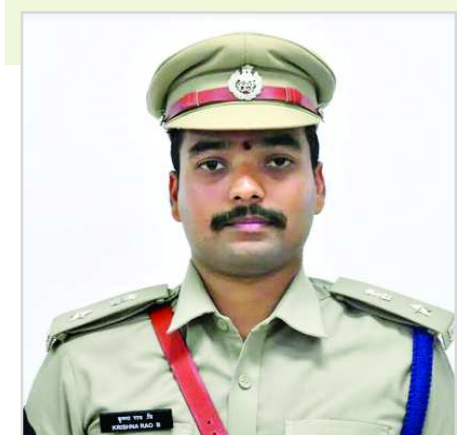
పాటించడంలో కరోనా వైరస్ కట్టిడికి వీలవుతుందని, జిల్లా ప్రజలు సహకరించాలని కోరారు.

- ప్రభుత్వ ఆసుపత్రుల్లో 4 నెలలుగా జీతాలేవ - దయనీయ పరిస్థితుల్లో. పారిశుధ్య కార్యకర్లు