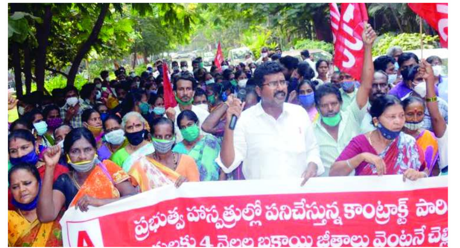
విశాఖపట్నం : కేజీహెచ్ సూపర్స్పెండ్ కార్యాలయం ముంగిట... ప్రభుత్వ ఆసుపత్రిలో పనిచేస్తున్న కాంట్రాక్టు పారిశుధ్య కార్యకర్లు

కరోనా వైరస్ నియంత్రణలో నిర్లక్ష్యంగా వ్యవహరించే వారిపై, నిబంధనలు ఉల్లంఘించే వారిపై పోలీస్ శాఖ కేసులు నమోదు చేస్తామని అన్నారు. విషిల్డ్, కొవ్వొత్త వ్యాక్సిన్ లు భారత దేశం ప్రపంచ దేశాలకు పంపిణీ చేస్తుందని, ప్రజలందరూ ఈ వ్యాక్సిన్ పట్ల ఎటువంటి అపోహలు పెట్టుకోవద్దన్నారు. ప్రతి ఒక్కరూ ఈ వ్యాక్సిన్ వేసుకోవాలని, అనారోగ్య సమస్యలు ఉన్న వారు డాక్టర్ సలహా మేరకు తీసుకోవాలన్నారు. కరోనా వైరస్ గురించి ప్రభుత్వం విడుదల చేసే (ఆరోగ్య శాఖ) నియామక నిబంధనలు పాటించాలన్నారు. ఇప్పటికే కొంత మంది ప్రజలు మరియు జిల్లా పోలీసులు మొదటి డోసు తీసుకున్నారని రెండో డోసు వైద్యుల సలహా మేరకు 4 నుండి 8 వారాలు మధ్యలో తీసుకోవాలన్నారు.