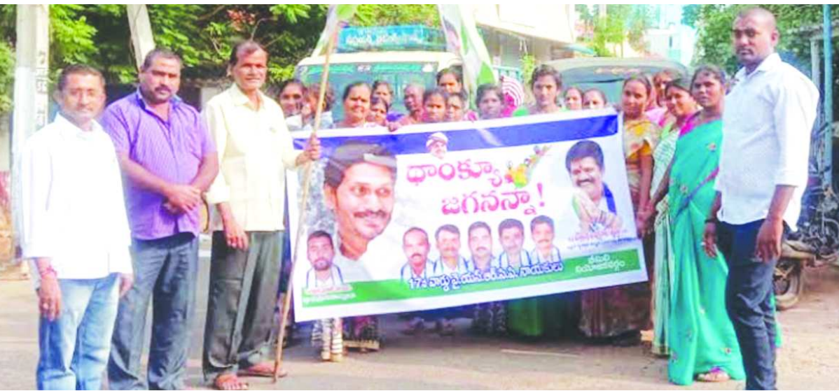
భీమునిపట్నం: ముఖ్యమంత్రి వైఎస్ జగన్మోహన్ రెడ్డి విశాఖ పట్టణం నేపథ్యంలో... మంత్రి అవంతి ఆదేశాలు మేరకు... భీమిలి డివిజన్ 17,18,19,20, 21 వార్డు నుండి సుమారు 600 మంది మహిళలను(ఆటోల లో) ర్యాలీగా వెళ్ళారు.