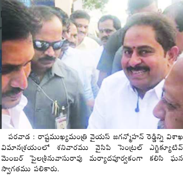
పరవాడ : రాష్ట్రముఖ్యమంత్రి వైయస్ జగన్మోహన్ రెడ్డిని విశాఖ విమానశ్రయంలో శనివారము వైసిపి సెంట్రల్ ఎగ్జిక్యూటివ్ వెంబర్ పైలెట్ సమావేశం ముగియడంతో కలిసి ఘన స్వాగతము పలికారు.