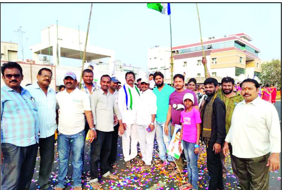
థాంక్స్ జగన్ అన్న నినాదంతో... దొండపల్లి రామాలయం. 15వ వార్షిక వైస్సార్ పార్క్ కార్యాలయం నుండి రాష్ట్ర ముఖ్యమంత్రికి స్వాగతం పలుకుతూ వైస్సార్ వార్డు సైనికెంట్. నీలాపు. సర్కిళ్ళరెడ్డి, కార్యకర్తలు, మహిళలు, గ్రామ ప్రజలు తండోపతండాలుగా డిఆర్ఎం ఆఫీస్ పై ఓవర్ లైడ్ వరుకు విచ్చేసారు స్వాగతం పలికారు.