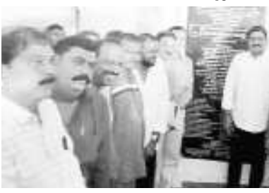
విశాఖపట్నం: గ్రామీణ ప్రాంతాలకు పట్టణ ప్రాంతాలకు రోడ్డు, విద్యుత్ మంచినీటి సౌకర్యం కల్పించడమే ప్రభుత్వ