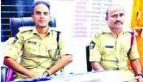
ఉండన్నారు. అనంతరం రికార్డులు పరిశీలించి సంతృప్తి వ్యక్తం చేశారు. ఆయనతో పాటు ఎస్పీ మధు సూధన రావు తెలిపారు.

కోటపురట్ల : నేరాల అదుపునకు ప్రత్యేక చర్యలు తీసుకుంటున్నామని నర్సపట్నం ఏఎస్పీ రిపోర్ట్ రెడ్డి అన్నారు. ఆదివారం రాత్రి ఆయన కోటపురట్ల పోలీస్ స్టేషన్ ను సందర్శించారు. ఈ సందర్భంగా ఆయన స్థానిక విలేజ్ కులతో మాట్లాడుతూ కొత్తగా రావడంతో డివిజన్ లోని ప్రధాన సమస్యలు తెలుసుకుంటున్నానని చెప్పారు. ముఖ్యంగా గంజాయి రవాణా, మావో యిస్సుల ప్రభావం, రోడ్డు ప్రమాదాల నివారణపై దృష్టి సారీస్తున్నట్లు తెలిపారు. ఇక్కడ రాజకీయ ఒత్తిడి లేదని, ఈ ఆయనతో పాటు ఎస్పీ మధు సూధన రావు ప్రాంతంలో ప్రశాంతమైన వాతావరణం కలిగి