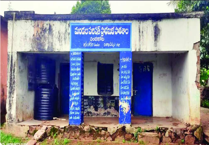
అనంతగిరి : భీంపొలు పంచాయతీ నందకోట గ్రామంలో ప్రాథమిక పాఠశాల భవనం పూర్తిగా పాడైపోయిందని పిల్లల తల్లిదండ్రులు ఆవేదన చెందుతున్నారు. ఈ పాఠశాలలో సుమారు ముప్పై మంది పిల్లలు చదువుకుంటున్నారని తెలిపారు. ఈ పాఠశాలలో తలుపులు కిటికీలు గుమ్మాలు మొత్తం పాడైపోయాయని తెలిపారు ఏ సమయంలోనైనా పాఠశాల శాఖ పెప్పులు విరిగి పిల్లలపై పడతాయోనని తల్లిదండ్రులు భయాందోళన చెందుతున్నారు. తక్షణమే కొత్త భవనం నిర్మించాలని లేదా పూర్తి మరమ్మతులు చేపట్టాలని ఉన్నతాధికారులకు కోరుతున్నారు.