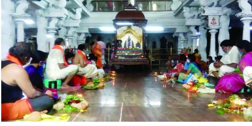
అన్నవరం : తూ.గో.జిల్లా ప్రముఖ పుణ్య క్షేత్రము అన్నవరం శ్రీ వీరవెంకట సత్య నారాయణ స్వామివారి దేవస్థానంలో అక్టోబర్ 1 నుంచి ఆన్ లైన్ వ్రతములు ప్రారంభం