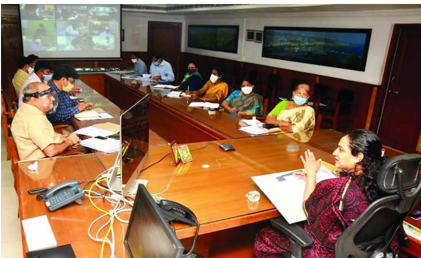
విశాఖపట్నం : స్పందన మరియు ఇ.ఆర్.పి దరఖాస్తులను వెంటనే పరిష్కరించాలని జి.వి.ఎం.సి. కమిషనర్ డా. జి. సృజన

అదేశించారు. సోమవారం జి.వి.ఎం.సి. సమావేశ మందిరం నుండి జి.వి.ఎం.సి. హెచ్.డి.లతో కలిసి అన్ని జోనల్ కమిషనర్లు వార్డు ప్రత్యేక అధికారులతో వీడియో కాన్ఫరెన్స్ నిర్వహించారు. ఈ సందర్భంగా ఆమె మాట్లాడుతూ ముఖ్యంగా స్పందనలో ప్రజల నుండి వచ్చిన దరఖాస్తులను ఈ రోజు సాయంత్రం లోగా పూర్తి చేయాలని అధికారులను ఆదేశించారు. రెవెన్యూకు సంబంధించిన అంశంపై ప్రజల నుండి వచ్చిన దరఖాస్తులు ఎక్కువగా పెండింగులో ఉన్నాయని రెవెన్యూ నిబ్బంది పై ఆగ్రహం వ్యక్తం చేసారు. ఈ కార్యక్రమంలో జి.వి.ఎం.సి. అధికారులు