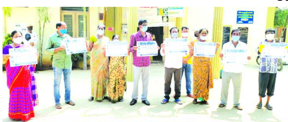
ఆస్పత్రి వద్ద నిరసన తెలుపుతున్న పారిశుధ్య కార్మికులు