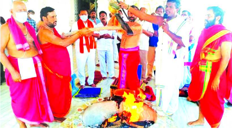
తదితరులు పాల్గొన్నారు. వేద పండితుల వేద ఆశీర్వాదములు అనంతరం తీర్చి, ప్రసాదములు అందజేశారు.