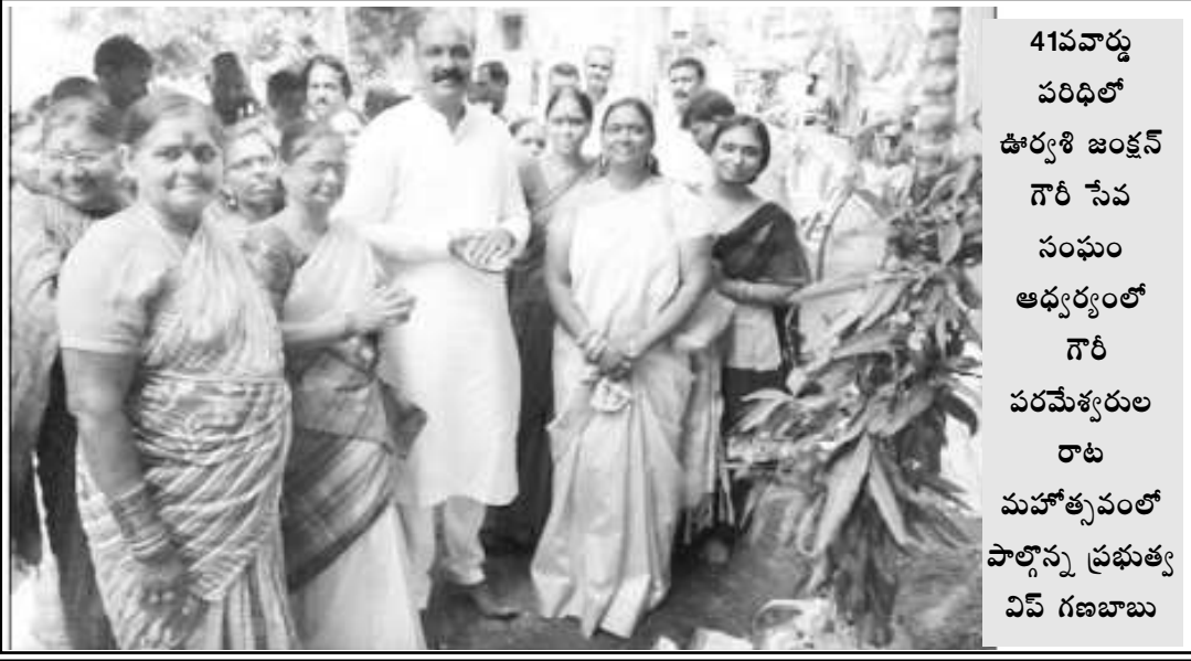
41వ వార్షిక పరిధిలో ఊర్యశి జంక్షన్ గౌరీ సేవ సంఘం ఆధ్వర్యంలో గౌరీ పరమేశ్వరుల రాట మహోత్సవంలో పాల్గొన్న ప్రభుత్వ వివే గణబాబు

ధీర్ఘ సైబల్ పోలీస్ ఎస్టాబ్లిష్మెంట్ చట్టం-1946 ప్రకారం కేంద్రం సీబీఐని ఏర్పాటు చేసింది. దీనిప్రకారం ఢిల్లీ భూ భాగం పరిధిలోనే సీబీఐ పనిచేయటానికి అవకాశమున్నది. ఢిల్లీ బయట ఏ రాష్ట్రంలోనైనా దర్యాప్తు, సోదాలు చేయరాదే, అయీ రాష్ట్ర ప్రభుత్వాలకు తమ భూ భాగం పరిధిలో దర్యాప్తునకు వీలు కల్పిస్తూ సాధారణ సమ్మతి తెలుపుతూ నోటిఫికేషన్ జారీ చేయాలి. ఇలాంటి సాధారణ సమ్మతి నోటిఫికేషన్ గత ఆగస్టు దాకా ఆంధ్రప్రదేశ్ ప్రభుత్వం విడుదల చేసింది. ఆ తర్వాతి కాలంలో కేంద్రంతో చంద్రబాబుకు చెడింది. ఆ తర్వాత కాలంలో ఏపీ, తెలంగాణ రాష్ట్రాల్లో కొన్ని సంస్థలపై ఐటీ సోదాలు జరిగాయి. దీంతో చంద్రబాబు ప్రభుత్వం సీబీఐని నిలువరించే పనికి శ్రీకారం చుట్టినట్టు కనిపిస్తున్నది. ఈ క్రమంలోనే సీబీఐలో అంతర్గత, ఆధిపత్య పోరు, అవినీతి ఆరోపణలు వెలుగుచూశాయి. బాబుకు కలిసి వచ్చింది. ఈ నేపథ్యంలోనే ఏపీలోని ఓ సీనియర్ న్యాయవాది సీబీఐ ప్రతిష్ట దెబ్బతీస్తున్నదని, పనితీరులో విశ్వసనీయత లోపించిందంటూ, రాష్ట్రంలో అవినీతి కార్యకలాపాలపై రాష్ట్రంలోని అవినీతి నిరోధకశాఖ సమర్థంగా పనిచేయగలదని ఏపీ ప్రభుత్వానికి వినతి ప్రకటించారు. దీంతో చంద్రబాబు తమ రాష్ట్రంలో సీబీఐ సేవలు అవసరం లేదని తేల్చిచెప్పే చర్యలకు దిగటం కనిపిస్తున్నది. మోడీ, చంద్రబాబు ఇరువురూ తమ రాజకీయ ప్రయోజనాల కోసం, ఆధిపత్యం కోసం రాజ్యాంగసంస్థల పనిలో జోక్యం చేసుకునేవిధంగా వ్యవహరించటం గర్హనీయం.