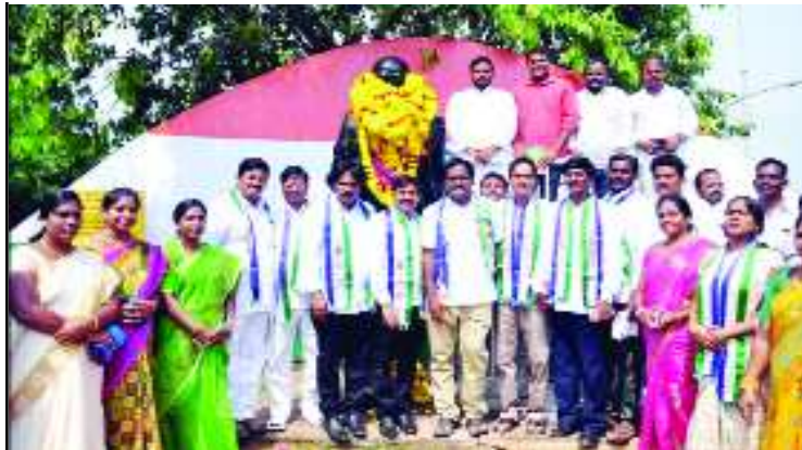
మహాత్ముని గాంధీ 150 వ జయంతి సందర్భంగా ముందుగా మహాత్ముని గాంధీ చిత్ర పటానికి పూలమాలలు వేసి నివాళులు అర్పించారు. తదుపరి లాల్ బహదూర్ శాస్త్రి చిత్ర పటానికి పూలమాలలు వేసి నివాళులు అర్పించారు.

నడవాలని ప్రజలను కోరారు. మహాత్ముని త్యాగం వలన మనకు స్వాతంత్ర్యం సిద్ధించిందన్నారు. ఆయనను ఎప్పటికీ మరిచి పోకూడదని మన మదిలో స్ఫూరించు కోవాలని అన్నారు. ఈ కార్యక్రమంలో సిబ్బంది, విద్యార్థులు పాల్గొన్నారు.