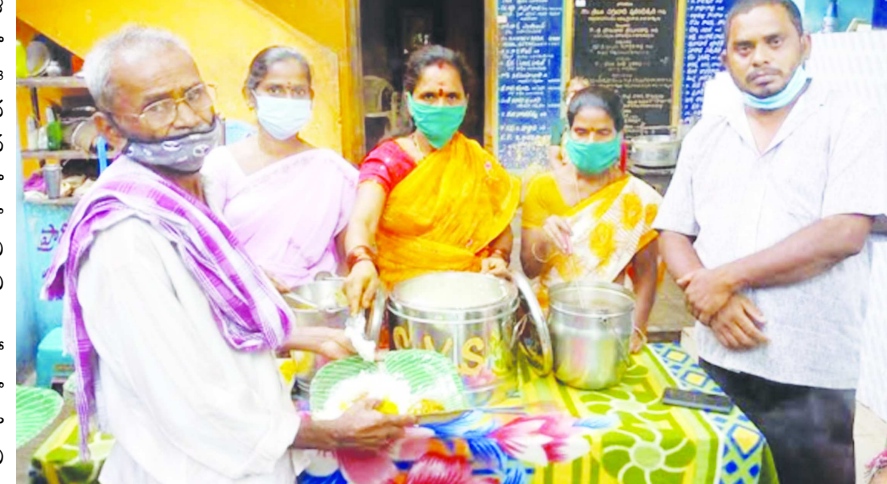
స్వామి ఆలయానికి అప్పగించడం జరుగుతుందని వెల్లడించారు. ఈ అన్నదాన సేవా కార్యక్రమంలో సంస్థ మహిళా సభ్యులంతా ఉత్సాహంగా పాల్గొన్నారు.