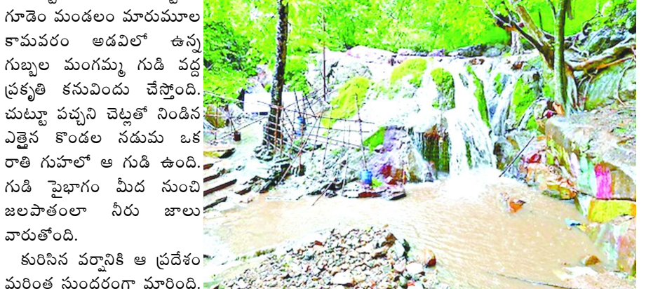
బుట్టాయగూడెం : బుట్టాయ గూడెం మండలం మారుమూల కామవరం అడవిలో ఉన్న గుబ్బల మంగమ్మ గుడి వద్ద ప్రకృతి కనువిందు చేస్తోంది. చుట్టూ పచ్చని చెట్లతో నిండిన ఎత్తైన కొండల నడుమ ఒక రాతి గుహలో ఆ గుడి ఉంది. గుడి పైభాగం మీద నుంచి జలపాతంలా నీరు జాలు వారుతోంది.