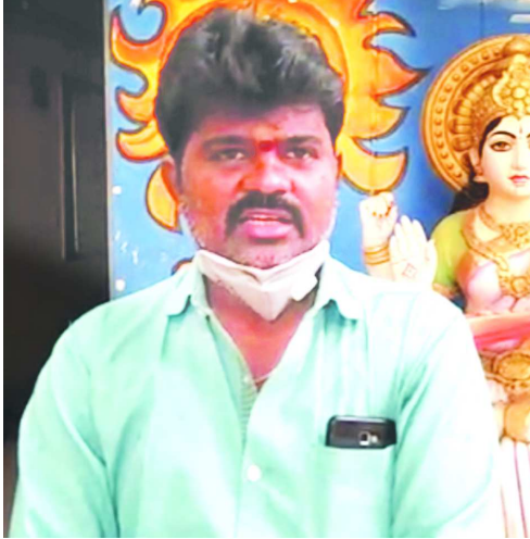
అనకాపల్లి : స్థానిక గవర్నమెంట్ లోని జీవించిన బాలికల ఉన్నత పాఠశాల హైస్కూల్ లో ఉన్న స్కూల్

కమిటీని తక్షణమే రద్దు చేయాలని కమిషన్ల దండుకున్న అంశంలో నిష్పాక్షిక దర్యాప్తు చేపట్టి అందుకు కారకులైన పారిశుధ్య చేపట్టాలని వైసీపీ నాయకుడు పారిశుధ్య నాయకుడు డిమాండ్ చేశారు శుక్రవారం స్థానిక విలేజ్ కలెక్టర్ ఆయన మాట్లాడుతూ ముఖ్యమంత్రి జగన్ మోహన్ రెడ్డి ప్రమాణస్వీకారం చేసిన నాటి నుండి ప్రభుత్వ పాఠశాలలు అభివృద్ధి పై దృష్టి సారించారని అందుకోసం ప్రతిష్టాత్మకంగా నాడు-నేడు కార్యక్రమాన్ని ప్రారంభించారు అన్నారు ప్రైవేట్ పాఠశాలలకు డిటుగా ప్రభుత్వ పాఠశాల తయారుచేసి నాణ్యమైన విద్యను విద్యార్థులకు అందించాలనే లక్ష్యంతో చేస్తున్న కార్యక్రమాల ప్రతిపక్షానికి మెగుడు పడడం లేదని అందులో భాగంగా స్థానిక గవర్నమెంట్ లోని హైస్కూల్ గత టీడీపీ ప్రభుత్వం ఎన్నిక కాబడిన స్కూల్ కమిటీ పాఠశాల నాడు నేడు కార్యక్రమాల్లో భాగంగా అవినీతికి