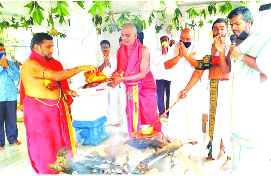
పాల్గొన్నారు. వేద పండితుల వేద ఆశీర్వాదములు అనంతరం తీర్థ ప్రసాదములు అందజేశారు.