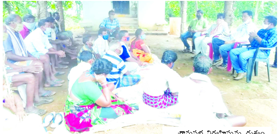
గ్రామసభ నిర్వహిస్తున్న దృశ్యం గొలుగొండ : గొలుగొండ మండలం సాలిక మల్లవరం పంచాయతీ పాగచెట్లపాలెం గ్రామంలో... రెవెన్యూ అధికారులు శుక్రవారం పోడు భూముల హక్కు పత్రాల కోసం గ్రామసభ నిర్వహించారు. ఈ కార్యక్రమంలో మండల రెవెన్యూ ఇన్ స్పెక్టర్ సర్పంచ్ గౌరవులు, విలేజ్ రెవెన్యూ అధికారి పదార్ పాల్గొన్నారు.