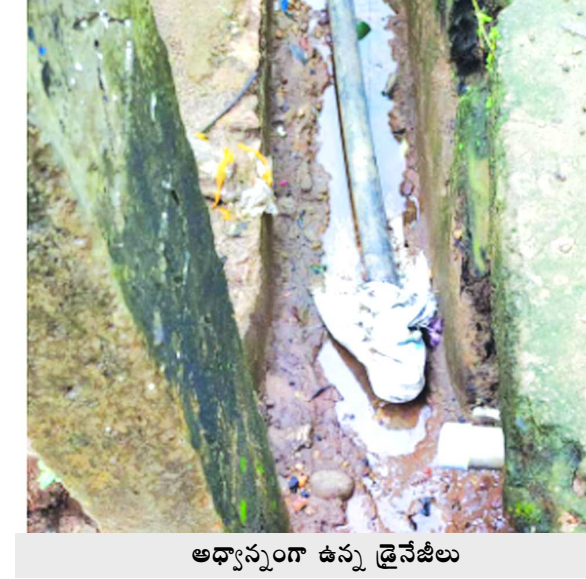
అధ్యాపనంగా ఉన్న డ్రైనేజీలు