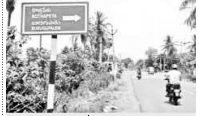
కొత్తకోటకు బదులు కొత్తపేట పేరుతో ఏర్పాటు చేసిన బోర్డు

మాకవరపాలెం : గ్రామం పేరు తెలిపే ఓ బోర్డుతో ప్రయాణికులు ఇబ్బందులు పడుతున్నారు. పైడిపాల సెంటర్ నుంచి బూరుగుపాలెం మీదుగా రోలుగుంట మండలం కొత్తకోట గ్రామం లోని వెళ్తున్న రోడ్డులో కొత్తకోట గ్రామానికి బదులు కొత్తపేట అనే పేరుతో బోర్డు ఏర్పాటు చేశారు. దీంతో ఈ గ్రామం ఎక్కడ ఉందా అని ప్రయాణికులు ఆలోచనలో పడుతున్నారు. గత్యంతరం లేక కొత్తకోట వెళ్లే కొత్తవారు దారి పొడవునా సమాచారం తెలుసుకుంటూ గ్రామానికి చేరుకోవాల్సి వస్తోంది. ఇప్పటికైనా ఆర్ఆర్డిబి అధికారులు స్పందించి బోర్డుపై ఉన్న పేరును సరి చేయాలని కోరుతున్నారు.