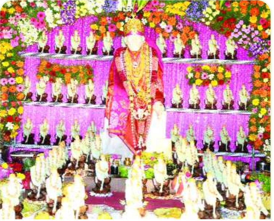
విశాఖపట్నం మహా నగరంలో ఈస్ట్ పాయింట్ కాలనీలో సర్కాంగమందరంగా ఆలరించిన సాయిబాబా విగ్రహం. అనంతరం భక్తులు దర్శనం చేసుకున్నారు.