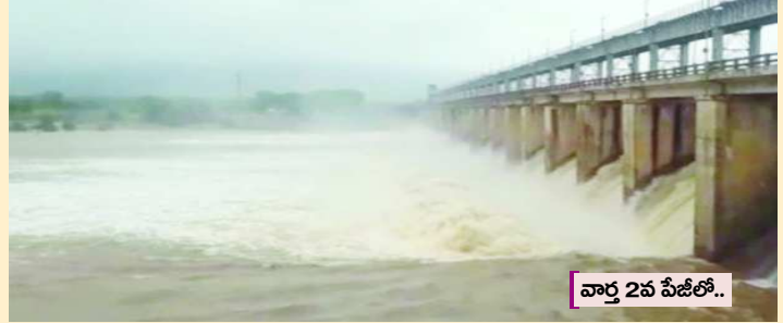
వార్షిక 2వ పీజీలో..