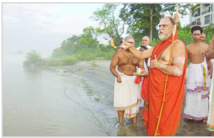
సంప్రక్కణ పేరుతో మూసివేత తగదని ఆన్నారు. దీనివలన భక్తులు చాలా మంది బాధపడుతున్నారని ఆన్నారు. భక్తుల మనోభావాలు దెబ్బతినకుండా తిరిగి వచ్చే నిర్ణయం తీసుకున్నా ఆగమ సలహా మండలి పీఠాలైన శృంగేరి వంటి పీఠాలలో గల ఆగమ పండితులతో సూచనలు తీసుకుంటే బాగుంటుందని సలహా ఇచ్చారు. టిటిడి మండలి సలహాలు తీసుకునేటప్పుడు కార్యాలయంలో సీసీ కెమెరాలు నిలుపుదల చేయరాదన్నారు. కావున, టిటిడి మరియు ప్రభుత్వం కూడా సరియైన నిర్ణయం తీసుకోవాలన్నారు.

ఋషికేశ్: తిరుమల తిరుపతి దేవస్థానం చేపట్టనున్న మహాసంప్రక్కణ విషయంలో తీసుకున్న నిర్ణయంపై స్వామి వారు స్పందిస్తూ తిరుమల తిరుపతి దేవస్థానం ఆలయం మూసివేతపై పలువురు భక్తుల మనోభావాలు దెబ్బతిం టాయని మహాస్వామి పేర్కొన్నారు. జూలై 27 నుండి సెప్టెంబర్ 25 వరకు చాతుర్మాస్య దీక్ష నిమిత్తమై ఋషికేశ్ దీక్ష ప్రారంభించిన సందర్భంగా తిరుమల తిరుపతి దేవస్థానం తీసుకున్న నిర్ణయంపై స్పందించారు. ఆగస్టు 9 నుండి 16వ తేదీ వరకు తిరుమల దేవాలయాన్ని మహా