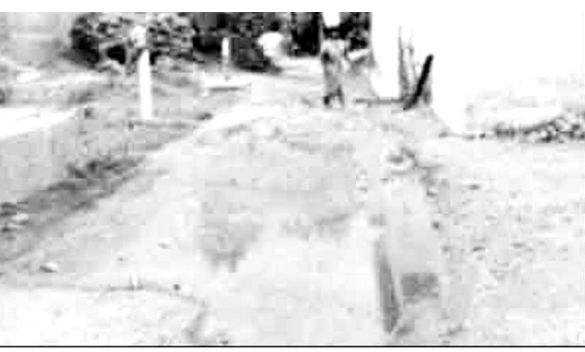
వీధి మధ్యలో మురుగు ఉన్న దృశ్యం

రావికమతం : దొండపూడి గ్రామంలోని కొప్పాకవారి వీధిలో ఇటీవల సిమెంట్ రోడ్డు నిర్మించారు. అయితే రోడ్డుకు ఆ చివర ఈ చివర ఎత్తుగా నిర్మించి మధ్యలో పల్లం వదిలేశారు. దీనికి తోడు డ్రైనేజీ కూడా లేదు. దీంతో వీధిలో ఉన్న తాగునీటి బోరు పుదా సరంతా రోడ్డు మధ్యలో నిలిచిపోతుంది. అలాగే ఇళ్లలోని వాడుక నీరు, వర్షం నీరు కూడా ఇప్పటికే చేరుతుంది. దీంతో స్థానికులు రాకపోకలకు ఇబ్బంది పడటమే కాకుండా దోమలు, ఈగల వ్యాధి అధికమౌతుంది. రోడ్డు నిర్మించడం వల్ల తమకు ఎలాంటి ప్రయోజనం ఉండటం లేదని స్థానికులు ఆవేదన వ్యక్తం చేస్తున్నారు. తక్షణమే పాలకులు, అధికారులు స్పందించి నిలిచి ఉన్న నీటిని బయటకు పంపించే విధంగా ప్రత్యామ్నాయ చర్యలు చేపట్టాలని కోరుతున్నారు.