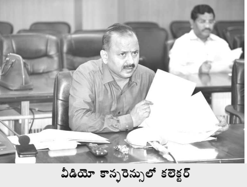
వీడియో కాన్ఫరెన్సులో కలెక్టర్

విజయనగరం: రైతులకు సకాలంలో విత్తనాలు అందించేందుకు అన్నిమండలాల్లో విత్తనాలు అందుబాటులో ఉంచడం జరిగిందని అలాగే సూక్ష్మ పోషక ఎరువులు సత్వరమే పంపిణీ చేయాలని జిల్లా కలెక్టర్ హరి జవహర్ లాల్ ఆదేశించారు. సోమవారం మండల స్థాయి అధికారులతో నిర్వహించిన వీడియో కాన్ఫరెన్సులో ఆయన మాట్లాడుతూ జాతీయ గ్రామీణ ఉపాధి హామీ పథకం ద్వారా చేపట్టే పనులు త్వరితగతిన పూర్తిచేయాలన్నారు. ఉపాధి హామీ పథకం కన్వర్జెన్సీ పనులు చేపట్టే గ్రామ పంచాయతీ భవనాలు, అంగన్వాడీ భవనాలు, సి.సి.రోడ్లు, ఎన్సెల్ జలసరఫరా క్రింద బోరు బావులు, వ్యవసాయ అనుబంధ రంగాలకు సంబంధించిన ఫీడర్ ఛానల్స్, కాలువ