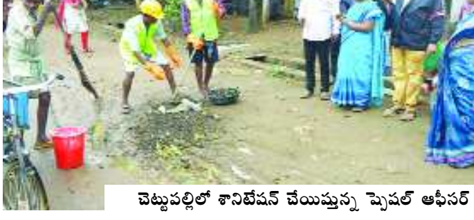
చెట్టుపల్లిలో శానిటేషన్ చేయిస్తున్న షెఫర్డ్ ఆఫీసర్