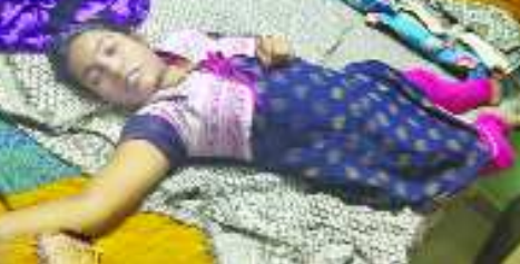
అనకాపల్లి : తుమ్మపాల గ్రామంలో మహిళ ఆత్మహత్యకు పాల్పడింది. గురువారం ఉదయం