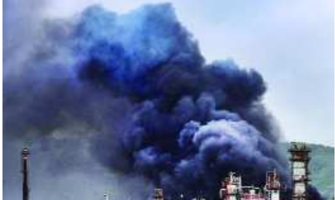
ఉన్నవో: హిందుస్థాన్ పెట్రోలియం ఫ్లాంట్లో గురువారం పెట్రోల్ ట్యాంకర్లో అకస్మాత్తుగా పేలుడు సంభవించింది. ఉత్తరప్రదేశ్ ఉన్నవోలో ఈ సంఘటన చోటుచేసుకుంది. ఫ్లాంట్లోని వాల్వ్ లీక్ అవడంతో ఈ పేలుడు జరిగినట్లు తెలుస్తోంది. అకస్మాత్తుగా ట్యాంకర్ తరువాయి 2లో..