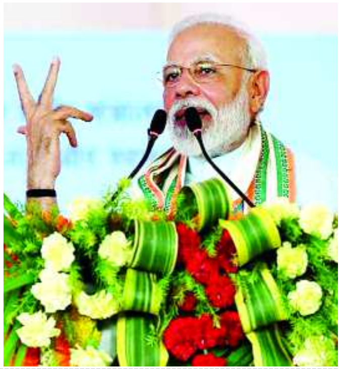
వ్యాఖ్యానించారు. ఈ పథకం కింద ప్రస్తుతం 18 నుంచి 40 సంవత్సరాల లోపు వయసు కలిగిన సన్న, చిన్నకారు రైతులు వారికి 60 సంవత్సరాలు వచ్చిన తర్వాత నెలకు రూ 3,000 పెన్షన్ అందుకుంటారు. రానున్న మూడేళ్లకు రూ 10,774 కోట్లను ప్రధానమంత్రి కిసాన్ మన్ ధన్ తరువాయి 2లో..

రాంచీ : రైతులకు పెన్షన్ అందించేందుకు ప్రతిష్టాత్మకంగా చేపడుతున్న ప్రధానమంత్రి కిసాన్ మన్ ధన్ యోజనను గురువారం ప్రధాని నరేంద్ర మోదీ రాంచీలో ప్రారంభించారు. ఈ పథకం జార్ఖండ్ను భారత్ తో పాటు ప్రపంచానికి అనుసంధానం చేస్తుందని ఈ సందర్భంగా ప్రధాని మోదీ