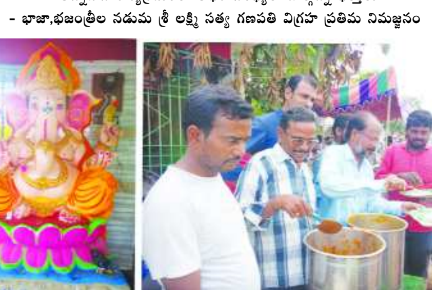
- అన్నదాన కార్యక్రమంలో అధిక సంఖ్యలో పాల్గొన్న భక్తులు - భాజాభజంత్రీల నడుము శ్రీ లక్ష్మీ సత్య గణపతి విగ్రహ ప్రతిమ నిమజ్జనం

అన్నవరం : తూ.గో.జిల్లా అన్నవరం స్థానిక రైల్వే స్టేషన్ రోడ్డు నందు ఉన్న శ్రీ లక్ష్మీ సత్య గణపతి ఆలయం(నల్ల వినాయకుని గుడి) వద్ద వినాయక చవితి ఉత్సవాలలో భాగంగా ప్రతిష్ఠించిన శ్రీ లక్ష్మీ సత్యగణపతి ప్రతిమ నవరాత్రులు అనంతరం నిమజ్జనోత్సవంలో భాగంగా ఆలయ ఉత్సవ కమిటీ వారి ఆలయంలో భారీ అన్నదాన కార్యక్రమం జరిగింది. ఈ అన్నదాన కార్యక్రమంలో భారీ ఎత్తున భక్తులు పాల్గొని శ్రీ స్వామివారి అన్న ప్రసాద మును స్వీకరించారు. అనంతరం సాయంత్రం శ్రీ లక్ష్మీ సత్య గణపతి స్వామివారి ప్రతిమను భాజాభజంత్రీల నడుము ఊరేగింపుగా తోడ్కొని పంపా సరోవరంలో నిమజ్జనం చేసారు. ఈ అధిక సంఖ్యలో భక్తులు పాల్గొన్నారు.