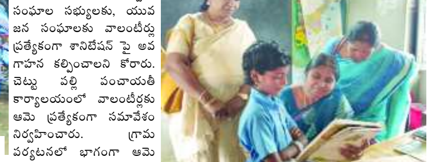
ఓ.యల్.పురంలో ఆంగ్ల పాఠం చదివిస్తున్న ప్రత్యేకాధికారి