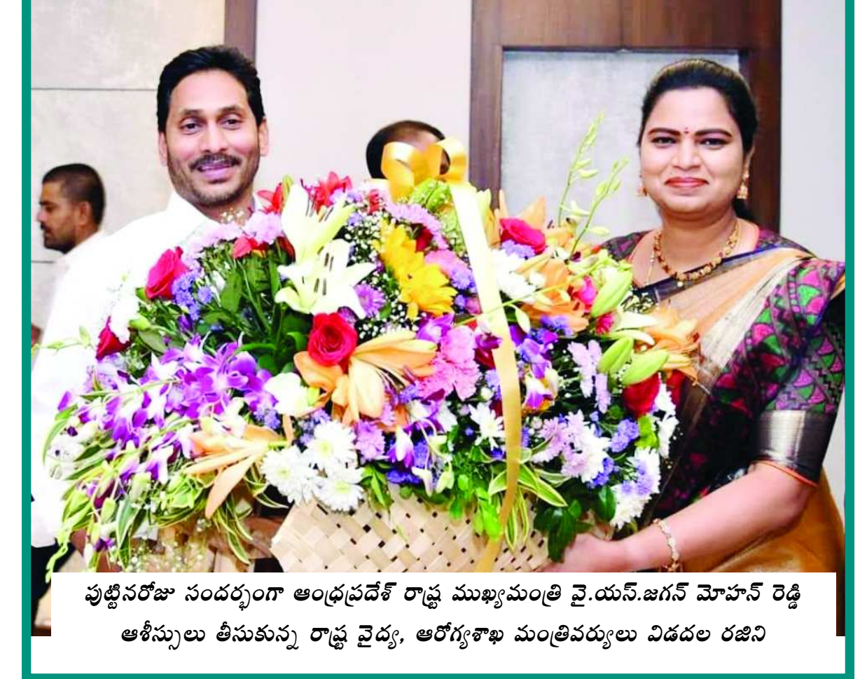
పుట్టినరోజు సందర్భంగా ఆంధ్రప్రదేశ్ రాష్ట్ర ముఖ్యమంత్రి వై.యస్.జగన్ మోహన్ రెడ్డి ఆశీస్సులు తీసుకున్న రాష్ట్ర వైద్య, ఆరోగ్యశాఖ మంత్రివర్యులు విడదల రజిని