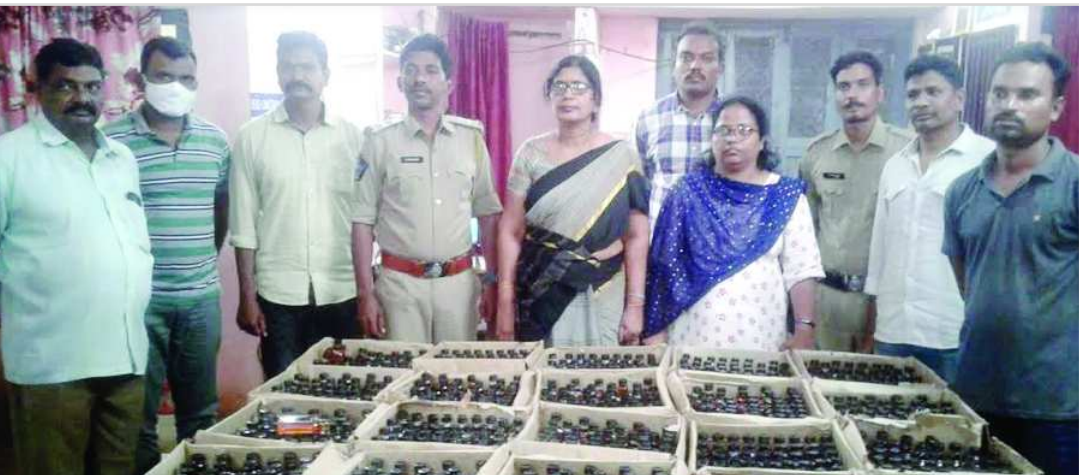
భీమునిపట్నం పద్మావతి మండలం రెడ్డిపల్లి గ్రామంలో సుమారు 8 వేల మద్ద్యం బాటిల్స్ ను పట్టుకున్న భీమిలి ఎక్స్రెజ్ పోలీసులు పట్టుకున్నారు.