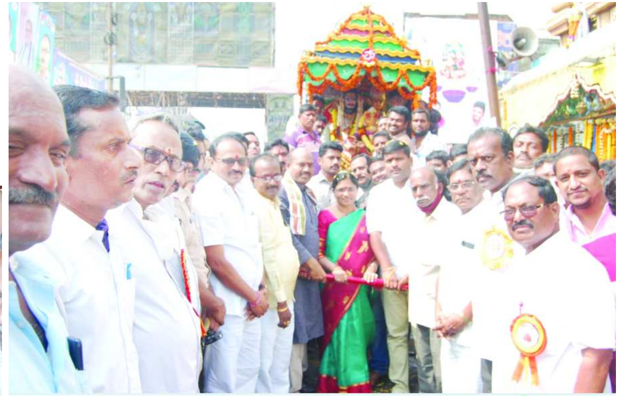
ఉత్సవ రథాన్ని ప్రారంభిస్తున్న ఎంపీ ఎమ్మెల్యే