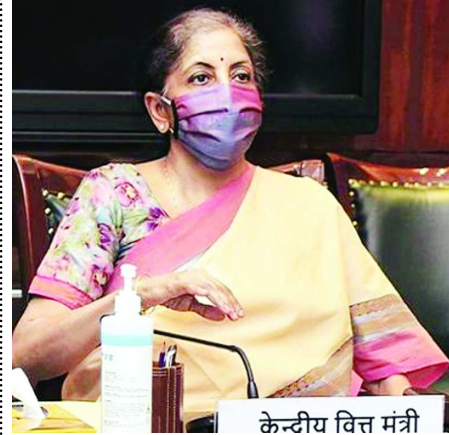
మ్యూడర్లీ : కోవిడ్-19తో ప్రభావితమైన వ్యాపార సంస్థలను కాపాడేందుకు సెప్టెంబర్ 15 నాటికి రుణ పునర్వ్యవస్థీకరణ ప్రణాళికను సిద్ధం చేయాలని ఆర్థిక మంత్రి నిర్మలా

సెప్టెంబర్ 15 నాటికి రుణ పునర్వ్యవస్థీకరణ సిద్ధం