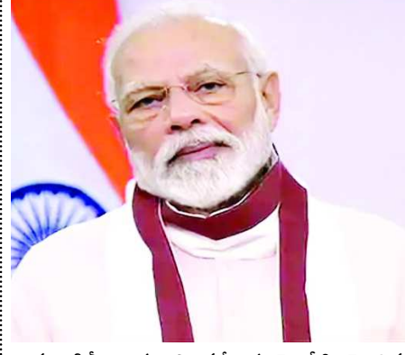
మ్యూడర్లీ : ప్రధాని నరేంద్ర మోదీకి చెందిన పర్సనల్ వెబ్సైట్ అకౌంట్ హ్యాక్ అయ్యింది. ఈ విషయాన్ని ట్విట్టర్ సంస్థ ద్రువీకరించింది.

జాతీయ రిలీఫ్ ఫండ్ కు క్రిప్టోకరెన్సీ రూపంలో విరాళాలు ఇవ్వవచ్చు అని ఆ వెబ్సైట్ పేజీలో ట్విట్టర్ కనిపించాయి. దీంతో ప్రధాని అకౌంట్ హ్యాక్ అయినట్లు ద్రువీకరించారు. అయితే మోదీ అకౌంట్ ను సెక్యూర్ చేసినట్లు కూడా ట్విట్టర్ సంస్థ వెల్లడించింది. ట్విట్టర్ సంస్థ ప్రతినిధి ఈ సంఘటనపై స్పందిస్తూ.. హ్యాకింగ్ గురించి తెలుసుకున్నామని, అకౌంట్ ను మళ్ళీ సెక్యూర్ చేశామని, ఈ సంఘటనను నిరంతరం దౌర్భాగ్యం చేస్తున్నామని, అయితే ప్రధానికి చెందిన ఇతర అకౌంట్లపై ప్రభావం పడింది అన్న విషయం తమకు తెలియదని అన్నారు. నరేంద్ర మోదీ (narendramodi_in) అకౌంట్ పై షాస్సు చేసిన ట్విట్టర్ కు