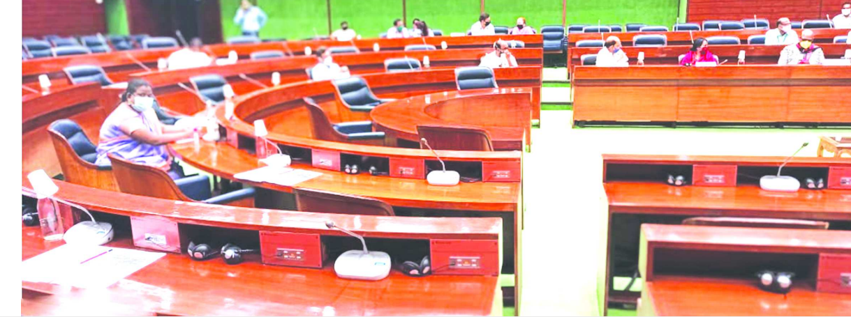
సమావేశంలో ఎంపీ మాధవి

కొయ్యూరు : సహజ సిద్ధ ప్రకృతి అందాలతో పర్యాటకులను ఆకట్టుకునే గిరిజన ప్రాంతాన్ని పర్యాటక రంగంలో మరింత అభివృద్ధి చేసే విధంగా చర్యలు తీసుకోవాలని అరకు ఎంపీ గొడ్డెటి మాధవి సూచించారు. ఢిల్లీ పార్లమెంట్ హౌస్లో జరిగిన రవాణా, పర్యాటక సంస్కృతి కమిటీ సమావేశంకు ఆమె హాజరయ్యారు. అంతరించిపోతున్న గిరిజన సంస్కృతిని నేటి తరానికి