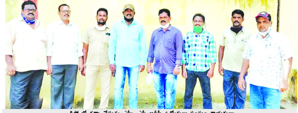
డిపో లో ధర్మా చేస్తున్న ఎస్సీ, ఎస్సీ ఆర్టీసీ ఉద్యోగులు సంఘం నాయకులు

ఆర్టీసీ ఎస్సీ ఎస్సీ ఎంప్లాయిస్ వెల్ఫేర్ అసోసియేషన్ డిమాండ్