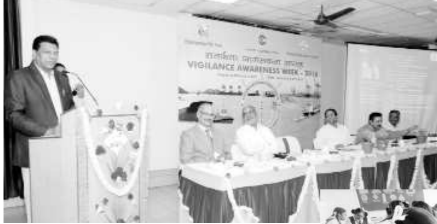
కార్పొరేట్, ఎయిడెడ్, మున్సిపల్, రూరల్ పాఠశాలల చిన్నారులకు పెయింటింగ్ లో పోటీ నిర్వహిస్తున్నట్లు వెల్లడించారు. కాలేజ్ విద్యార్థిని విద్యార్థులకు ఎస్సె రైటింగ్ నిర్వహిస్తున్నట్లు తెలిపారు.

సంతకాల సేకరణ, ప్లాస్ మాఫ్స్ మరియు స్కిట్ లను నిర్వహిస్తున్నట్లు వీటి ద్వారా అవినీతిపై ప్రజల్లో చైతన్యం కలిగించేందుకు ప్రయత్నిస్తున్నట్లు చీఫ్ విజిలెన్స్ అధికారి వెల్లడించారు.