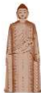
లేకువాన్ సేట్ క్వర్ జపాన్ 116 మీటర్లు