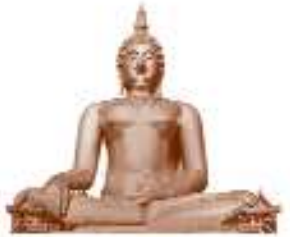
ద గ్రేట్ బుద్ధ థాయిలాండ్ 91 మీటర్లు