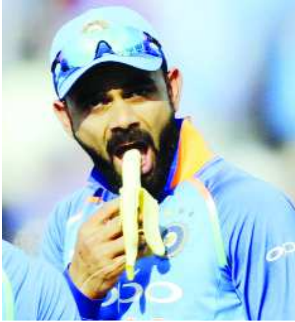
తుది నిర్ణయం తీసుకుంటామని వెల్లడించింది. టీమిండియా సారథి కోహ్లా, వన్డే వైస్ కెప్టెన్ రోహిత్ శర్మ, టెస్టు వైస్ కెప్టెన్ అజింక్య రహానె, కోచ్ రవిశాస్త్రి, చీఫ్ సెలెక్షర్ ఎమ్మెస్కే ప్రసాద్ ఈ సమీక్షకు హాజరయ్యారు.

ముంబయి: వచ్చే ఏడాది ఇంగ్లాండ్ లో వన్డే ప్రపంచకప్ సమయంలో తమకు చాలినన్ని అరటి పండ్లు సరఫరా చేయాలని టీమిండియా సారథి విరాట్ కోహ్లా కోరాడు. తమ భార్యలను సీరీస్ సాంతం తమతో ఉండేలా అనుమతించాలని, ఒక రైల్వే కోచ్ రిజర్వ్ చేయాలని బీసీసీఐకి విజ్ఞప్తి చేశాడని తెలిసింది. హైదరాబాద్ టెస్టు తర్వాత క్రేజ్ పాకుల సంఘం, జట్టు మేనేజిమెంట్ నిర్వహించిన సమీక్ష సందర్భంగా కోహ్లా పై కోరికలు కోరాడు. టీమిండియా ఆటగాళ్లు కోసిన పండ్లను గత పర్యటనలో ఇంగ్లాండ్ క్రేజ్ బోర్డు సరఫరా చేయడంలో విఫలమైంది. దీంతో కోహ్లా విజ్ఞప్తికి ఆశ్చర్యపోయిన పాకుల కమిటీ బీసీసీఐ ఖర్చులతో అరటి పండ్లు కొనివ్వాలని టీమిండియా మేనేజింగ్ అడ్డగాలని సూచించింది. సరైన జిమ్ సదుపాయాలున్న హోటళ్లనే బుక్ చేయాలని, విదేశీ పర్యటనల్లో భార్యలను తమతోనే ఉండనివ్వాలని విరాట్ కోరాడు అని విశ్వసనీయ వర్గాలు వెల్లడించాయి. భ్రష్ట గురించి భయపడిన పాకుల కమిటీ తొలుత రైలు ప్రయాణాన్ని అంగీకరించలేదు. అయితే ఇంగ్లాండ్ క్రేజ్ జట్టు రైల్వే ప్రయాణిస్తుందని, కోచ్ ను పూర్తిగా రిజర్వ్ చేసి బ్లాక్ చేయాలని కోహ్లా సూచించాడని సమాచారం. భారత ప్రేక్షకుల బృందాలు రైలు వద్ద గుమిగూడే అవకాశం ఉంటుందని, ఏదైనా చోటు చేసుకుంటే ఆటగాళ్ల భద్రతకు పూర్తి వహించాలని సీఓఐ తెలిపింది. ఇక ఆస్ట్రేలియా పర్యటనలో ఆటగాళ్ల భార్యలకు ప్రత్యేక బస్సు ఏర్పాటుకు అంగీకరించింది. కొందరు ఆటగాళ్ల భార్యలు ఉంటే ఆటపై శ్రద్ధ వహించలేదని ఏకాభిప్రాయం తర్వాత