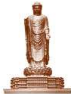
స్రింగ్ టెంపుల్ బుద్ధ చైసా 153 మీటర్లు

ఐక్యతకు ప్రతీకయైన విగ్రహం: ఐక్య భారత సర్దార్ పటేల్ కు నివాళి