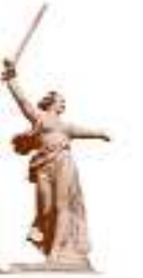
ద మదర్ లాండ్ కార్ట్ రష్యా 87 మీటర్లు

ప్రధానమంత్రి శ్రీ నరేంద్ర మోదీ ద్వారా దేశ ప్రజలకు అంకితం