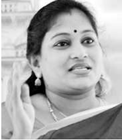
బీజేపీ డైరెక్షన్లో వైసీపీ యాక్షన్ చేస్తోంది. ఆంధ్రప్రదేశ్ లోని వ్యవస్థలపై, ప్రజలపై నమ్మకం లేదని జగన్ వ్యాఖ్యానించడం ఆయన దివాలకొరతనానికి నిదర్శనం.

విశాఖపట్నం : జగన్ పై జరిగిన కోడికత్తి డ్రామా విఫలమై.. వైసీపీ నేతల ప్రజల్లో అభిమానులను కాపడంతో ఆ పార్టీ నేతలకు దిక్కుతోచక ఇప్పటివరకు విమర్శలు చేస్తున్నారు. ఆపరేషన్ గరుడ పేరుతో రాష్ట్రంలో అత్యంత సృష్టించి రాష్ట్రపతి పాలన తీసుకురావాలనే వైసీపీ కుట్రలు ఫలించలేదు. దీంతో ఏం చేయాలో దిక్కుతోచక ఆ పార్టీ నేత రోజూ మాట్లాడుతున్నారు. జగన్ ఇంతవరకు కోడికత్తి డ్రామాపై వారు తెరవకపోవడం వారి కుట్ర కోణానికి నిదర్శనం. దాడి జరిగిన వెంటనే నవ్వుతూ హైదరాబాద్ ఎందుకు వెళ్ళాలో ఇప్పటి వరకు సమాధానం చెప్పలేదు? అప్పుడేమేమాలపై బీజేపీ నేతలు, వైసీపీ నేతలు స్పందించి ప్రభుత్వం బురదజల్లడం కుట్ర కాదా?