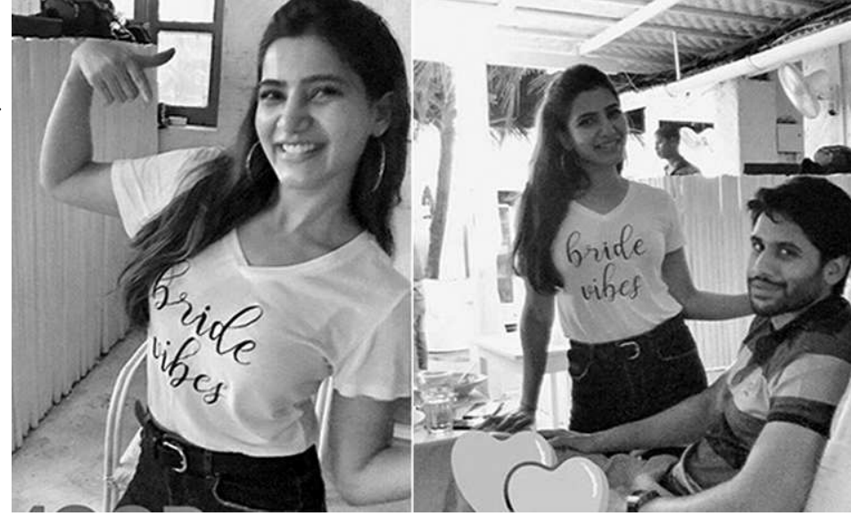
ఏర్పాటు చేస్తున్నట్లు నాగార్జున ప్రకటించిన విషయం తెలిసిందే.

నాగచైతన్య, సమంతల పెళ్లి ఘడియలు దగ్గరపడుతున్నాయి. శుక్రవారం గోవాలో జరిగే వివాహ వేడుకలో ఈ జంట మూడుముళ్ల బంధంలో ఒక్కటికాబోతున్నారు. పెళ్లికి ఇంకా రెండురోజులే మిగిలివుండటంతో వీరిద్దరు అవధుల్లేని ఆనందంతో కనిపిస్తున్నారు. తాజాగా నాగచైతన్య-సమంత కలిసి తీసుకున్న ఫోటోలు సోషల్ మీడియాలో హాట్ టాప్ చేస్తున్నాయి. ప్రేమజంట పుల్ జోషీతో కనిపిస్తున్న ఫోటోలు అభిమానుల్ని విశేషంగా ఆకట్టుకుంటున్నాయి. బ్రెడ్ వైఫ్ అనే క్యాప్షన్ రాసివున్న తెల్లటి టీషర్ ను సమంతా ధరించగా ఆమె పక్కన చైతూ చిరునవ్వులు చిందిస్తూ కనిపిస్తున్నాడు. అక్కినేని అభిమానులు ఈ ఫోటోలకు ఖదా అవుతున్నారు. కాబోయే దంపతులకు అంతా శుభం బరగాలని ఆశిస్తున్న సందేశాలు పెడుతున్నారు. హిందూ, క్రీస్టియన్ సంప్రదాయ పద్ధతుల్లో గోవాలో రెండు రోజుల పాటు వివాహం జరగనుంది. వివాహసంతరం హైదరాబాద్ లో భారీ స్థాయిలో రిసెప్షన్