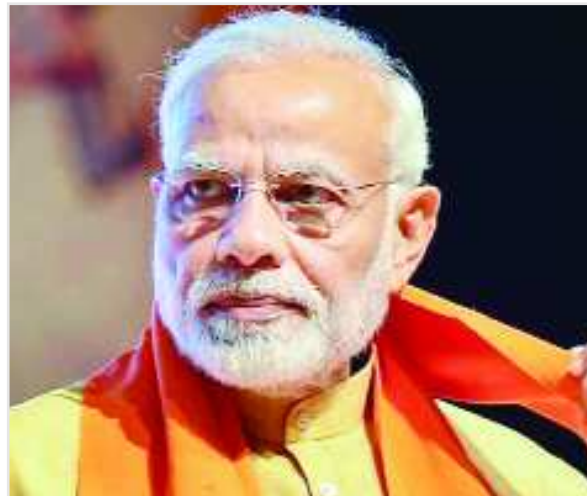
భువనేశ్వర్ : రాష్ట్రాన్ని త్వరితగతిన అభివృద్ధి పథంలోకి తీసుకెళ్లామంటే ఒరిస్సా సీఎం నవీన్ పట్నాయక్ అందుకు

దిల్లీ: దేశంలో 2030 నాటికి పేదరిక నిర్మూలనకు కృషి చేస్తామని కాంగ్రెస్ అధ్యక్షుడు రాహుల్ గాంధీ అన్నారు. దేశంలో అన్ని వర్గాలకు ప్రాధాన్యం లభించేలా మేనిఫెస్టోను రూపొందించామని చెప్పారు. కాంగ్రెస్ మేనిఫెస్టో విడుదల కార్యక్రమంలో ఆయన మాట్లాడారు. కొత్త మార్గదర్శకంలో కాంగ్రెస్ పార్టీ విజనీను ఆవిష్కరించామని చెప్పారు. ప్రజల ఆకాంక్షల మేరకు కాంగ్రెస్ పార్టీ మేనిఫెస్టోను విడుదల చేశామని తెలిపారు. దీన్ని గదిలో కూర్చుని రూపొందించలేదని, ప్రజల మనసులో ఆలోచన ప్రతిబింబించేలా రూపకల్పన చేశామని చెప్పారు. ముఖ్యంగా ఐదు అంశాలపై దృష్టి సారించామని వివరించారు. మేనిఫెస్టో విడుదల కార్యక్రమంలో యూపీఏ చైర్మన్ సోనియాగాంధీ, మాజీ ప్రధాని మన్మోహన్ సింగ్, ప్రయాణం గాంధీ, కేంద్ర మాజీ మంత్రి చిదంబరం, రణదీప్ సుర్రేవాలా తదితరులు పాల్గొన్నారు. ఈ ఐదింటిపై దృష్టి.. 1. న్యాయ పథకం ద్వారా ఏడాదికి రూ.72వేలు చొప్పున పేదలకు అందిస్తాం. ఈ పథకం రెండు రకాలుగా వనిచేస్తుంది. మొదటగా ఇది పేదల జీవనానికి ఉపయోగపడుతుంది. రెండోది నోట్ల రద్దులో దెబ్బతిన్న దేశ ఆర్థికవర్గంలోని మెరుగుపరుస్తుంది. 2. ప్రస్తుతం ఖాళీ ఉన్న 22 లక్షల తరువాయి 2లో..