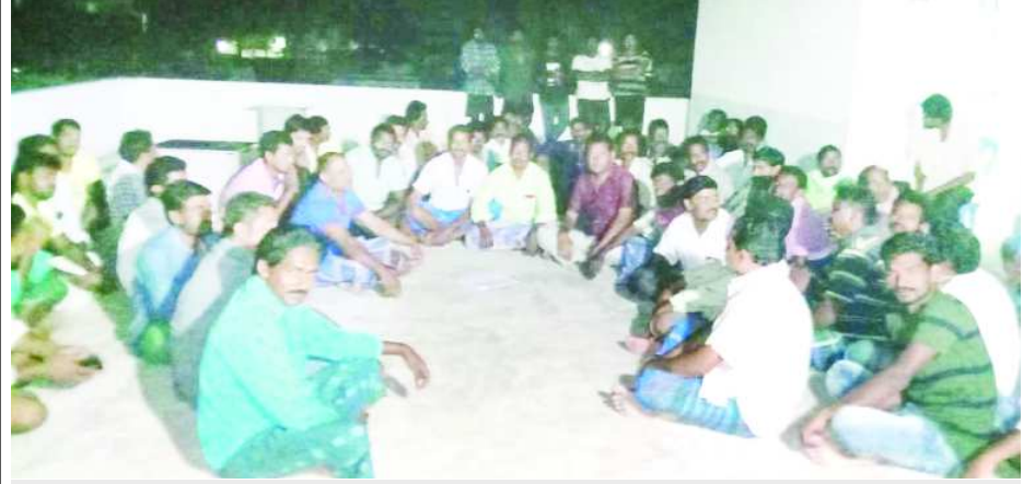
సమావేశమైన టీడీపీ కార్యకర్తలు