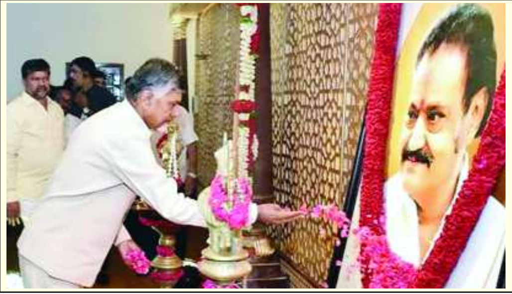
మాజీ మంత్రి, రాజ్యసభ సభ్యుడైన నందమూరి హరికృష్ణ ఇటీవల రోడ్డు ప్రమాదంలో దుర్మరణం చెందిన విషయం విదితమే. శనివారం హైదరాబాద్ లో ఆయన నివాసంలో హరికృష్ణ పటం వద్ద పూలమాల వేసి శ్రద్ధాంజలి పులిస్తూ ఏపీ సీఎం చంద్రబాబు నాయుడు