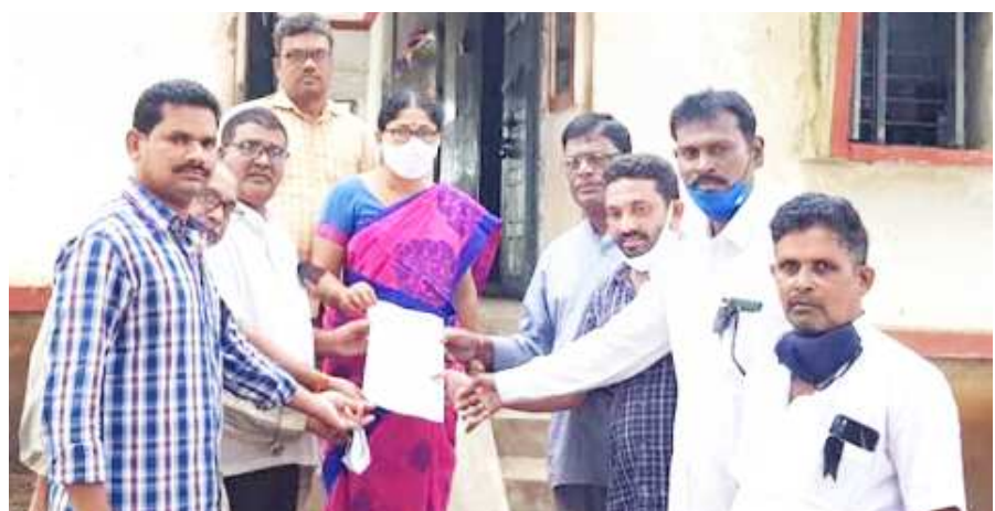
వినతిపత్రం అందజేస్తున్న దృశ్యం

గొలుగొండ : ఏపీయూడబ్ల్యూజే రాష్ట్ర నాయకత్వం ఇచ్చిన పిలుపు మేరకు మంగళ వారం గొలుగొండ మండలం జర్నలిస్టులు స్థానిక మండల కార్యాలయం ఎదుట నిరసన కార్యక్రమం చేపట్టారు. జర్నలిస్టులకు అక్రిడెషన్ మంజూరు చేయాలని, కోవిడ్ కారణంగా చని పోయిన జర్నలిస్టులకు ప్రభుత్వం ప్రకటించిన ఐదు లక్షల రూపాయల ఎక్స్ గ్రేడియా