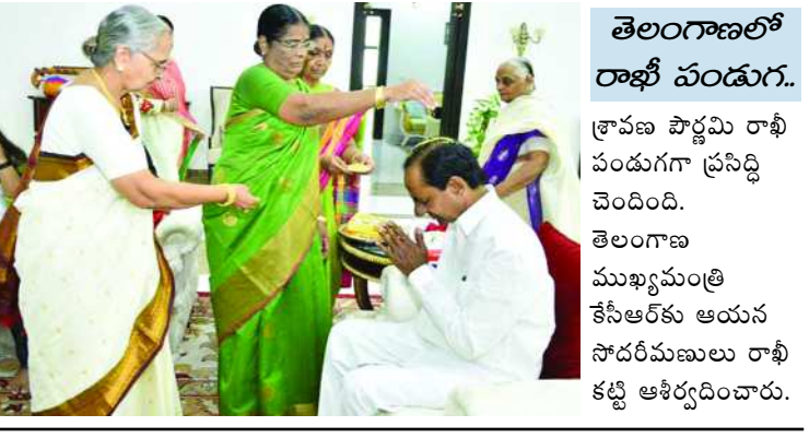
తెలంగాణలో రాఖీ వండుగు. శ్రావణ పౌర్ణమి రాఖీ వండుగుగా ప్రసిద్ధి చెందింది. తెలంగాణ ముఖ్యమంత్రి కేసీఆర్ కు ఆయన సోదరీమణులు రాఖీ కట్టి ఆశీర్వాదించారు.

దిల్లీ: అధికరణ 370 రద్దు నిర్ణయంతో సర్దార్ వజ్రే లాంటి స్వాతంత్ర్య సమరయోధుల కలలను సాకారం చేసే దిశగా ప్రభుత్వం చర్యలు తీసుకుందని ప్రధాని సరేంద్ర మోదీ అన్నారు. ముమ్మారు తలాక్ లాంటి దురాచారాలను రూపుమాపుతూ మెరుగైన భారతావని నిర్మాణానికి పటిష్ఠ చర్యలు తరువాయి 2లో..