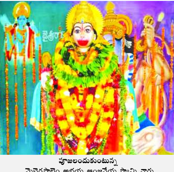
పూజలందుకుంటున్న మైచెర్లపాలెం అభయ ఆంజనేయ స్వామి వారు