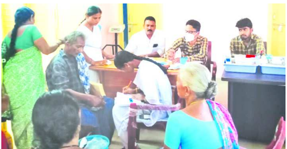
మెడికల్ క్యాంపు నిర్వహిస్తున్న దృశ్యం గొలుగొండ : గొలుగొండ మండలం కొమిర గ్రామ పంచాయతీ కార్యాలయంలో గురువారం 104 సిబ్బంది ఆధ్వర్యంలో ప్రత్యేక మెడికల్ క్యాంపు నిర్వహించారు.