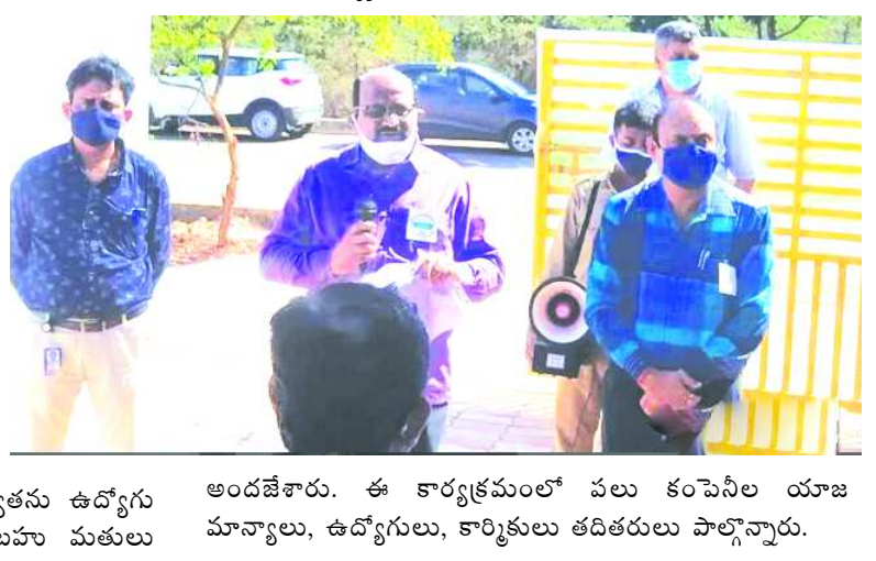
అందజేశారు. ఈ కార్యక్రమంలో పలు కంపెనీల యాజమాన్యము, ఉద్యోగులు, కార్మికులు తదితరులు పాల్గొన్నారు.

పరవడ : జాతీయ భద్రతా దినోత్సవం పురస్కరించుకొని, జవహర్లాల్ నెహ్రూ ఫార్మాసిటీ లో ఉన్న ఏం ఏ ఏస్ ఆర్ ఏం ఆధ్వర్యంలో 50 వ జాతీయ భద్రతా వారోత్సవాలను గురువారం అంగరంగు విభవంగా నిర్వహించారు.