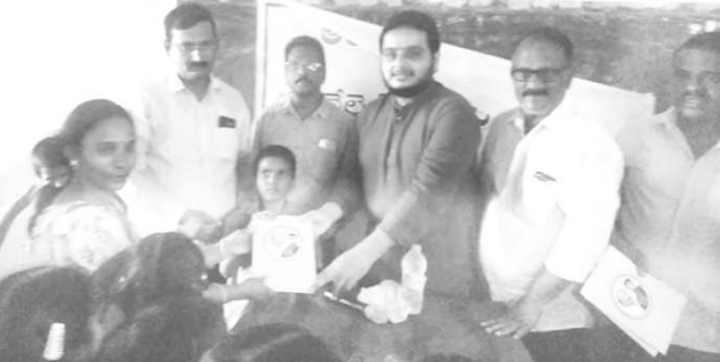
పుస్తకాలను అందజేస్తున్న ఆయుక్త యువసేన అధ్యక్షులు