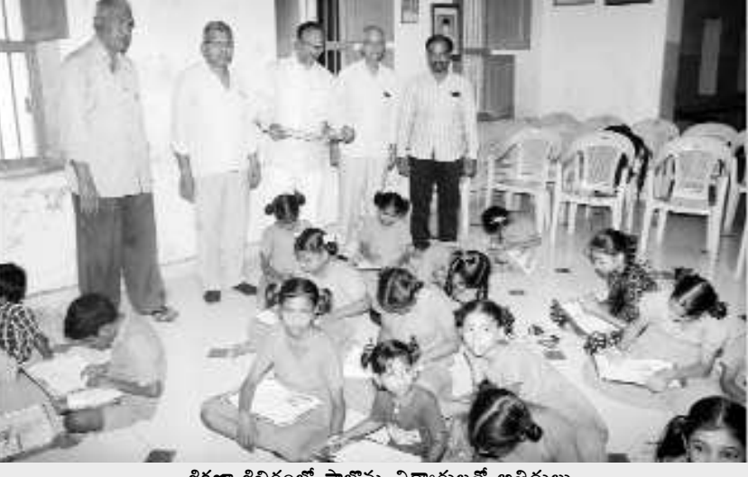
శిక్షణా శిబిరంలో పాల్గొన్న విద్యార్థులతో అతిథులు