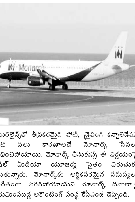
ఎయిర్లైన్స్ తో తీవ్రకలహం పోటీ, డ్రైవింగ్ కన్నా టిక్టెట్స్ వంటి పలు కారణాలచే మోనార్చ్ సేవలు స్తంభింపిపోయాయి. మోనార్చ్ తీసుకున్న ఈ నిర్ణయంపై సోషల్ మీడియా యూజర్లు సైతం విరుచుకు పడుతున్నారు. మోనార్చ్కు ఆర్థికపరమైన సమస్యలు ఎవవరంగా పెరిగిపోయాయని మోనార్చ్ డివలపై నియమించబడ్డ అకౌంటింగ్ సంస్థ కేపీఎంజీ చెప్పింది.

లండన్ : యూకేలో అతిపెద్ద ఎయిర్లైన్ సంస్థ మోనార్చ్ సంక్షోభంలో కూరుకుపోయింది. సోమవారం నుంచి మోనార్చ్ ఎయిర్లైన్స్ తన సేవలను నిలిపివేసింది. 3 లక్షల బుకింగ్స్ను కూడా ఈ ఎయిర్లైన్స్ రద్దు చేసింది. దీంతో విదేశాల్లో ఉన్న మోనార్చ్ విమాన ప్రయాణికులు ఇరకాటంలో పడిపోయారు. విదేశాల్లో చిక్కుకుపోయిన లక్షకు పైగా మోనార్చ్ ప్రయాణికులను జాగ్రత్తగా తిరిగి స్వదేశానికి తీసుకురావాలని సివిల్ ఏవియేషన్ అథారిటీ(సిఐఏఏ)ని బ్రిటీష్ ప్రభుత్వం ఆదేశించింది. ఈ మేరకు వారిని వెనక్కి తీసుకురావడానికి సిఐఏఏ 30కి పైగా ఎయిర్క్రాఫ్ట్లను నిర్దం చేసింది. మోనార్చ్ విమానాలను, హౌడిన్స్ను రద్దు చేస్తున్నట్లు ప్రకటించడం విచారకమంటూ మోనార్చ్ టిక్టెట్ల తన ద్వారా తన సేవల నిలిపివేతను ప్రకటించింది. మోనార్చ్ ప్రయాణికులు విమానశ్రయాలకు వెళ్లాలనుకుంటే రేదని, అక్కడ విమానాలు లేవంటూ పేర్కొంది. మోనార్చ్ తీసుకున్న ఈ నిర్ణయం తన కష్టమర్థం, ఉద్యోగులపై తీవ్ర ప్రభావం చూపుతుందనీ సిఐఏఏ చీఫ్ ఎగ్జిక్యూటివ్ ఆఫీసర్ ఆండ్రూ హైన్స్ చెప్పారు. యూకేలోని