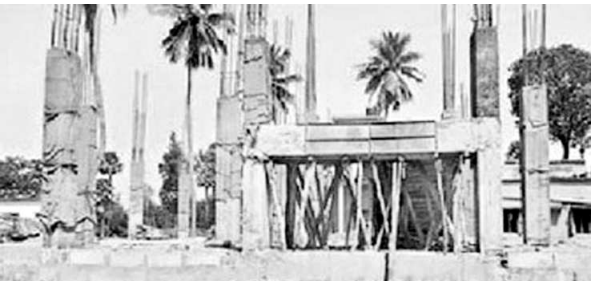
నిర్మాణంలో ఉన్న మండల పరిషత్ కార్యాలయం భవనం

నర్సపట్నం : నర్సపట్నం మండల పరిషత్ కార్యాలయానికి కొత్త భవన నిర్మాణ పనులు వేగవంతంగా జరుగుతున్నాయి. త్వరలో కొత్త భవనం సమకూరనుంది. రూ.1.10కోట్ల ఖర్చుతో తలపెట్టిన భవనం పనులు చురుగ్గా సాగు