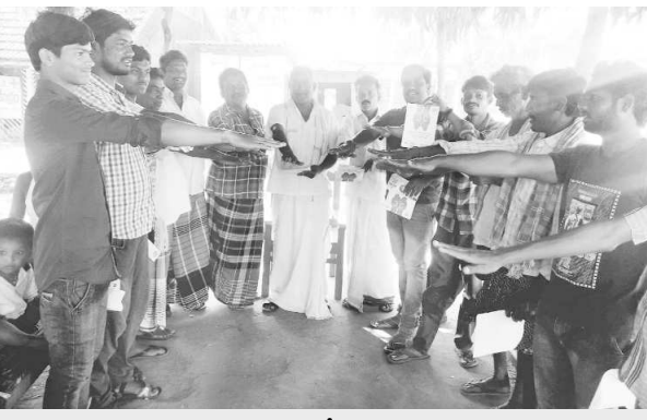
ప్రతిజ్ఞ చేస్తున్న దృశ్యం

రావికమతం : చైల్డ్ ఫండేషన్ ఇండియా లింక్ వర్కర్ స్కీమ్ వారు, ఆంధ్రప్రదేశ్ ఎయిడ్స్ నియంత్రణ సంస్థ వారి ఆదేశాల మేరకు డిసెంబరు 1 నుండి 31వరకు అవగాహన సమావేశాలు నిర్వహిస్తున్నామని చైల్డ్ ఫండే