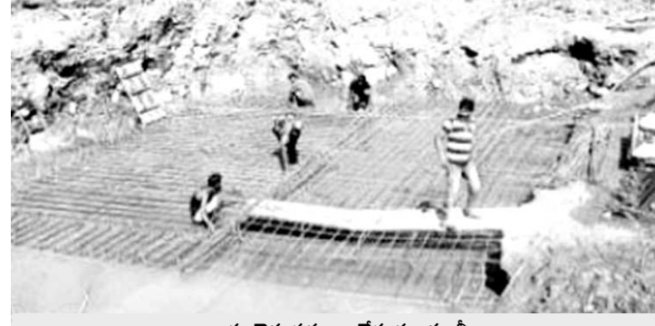
వంతెన పనులు చేస్తున్న కూలీలు

కొయ్యూరు : మండలంలోని బట్టపనుకుల గన్నెర్రపాలెం వంతెన పనులు ప్రారంభించారు. వర్షాల కారణంగా కొద్ది రోజులు పనులు నిలిచివేశారు. ఇటీవల వర్షాలు తగ్గడంతో పనులు చేపట్టారు. ఈ ఏడాది ఆగస్టు నుంచి పనులు మొదలుపెట్టారు. అయితే నాటి నుంచి వర్షం కావడంతో ఇక్కడ చేసిన సామగ్రి కూడాపోయింది. తాజాగా పనులు చేపట్టారు. 15 రోజుల పాటు వర్షాలు లేకుండా ఉంటే పునాది పనులను పూర్తి చేయనున్నారు. పునాది నుంచి మూడు రకాల ఇనుప ఊచలను వేస్తున్నారు. ఇది పూర్తయితే సిమెంట్ కాంక్రీట్ను వేస్తారు. ఈ ప్రక్రియ పూర్తి కావాలంటే 15 రోజుల సమయం పడుతుంది. దీంతో పాటు ఇనుప ఊచలను కత్తిరించేందుకు అవసరమైన విద్యుత్ కూడా లేదు. దీంతో కొన్ని సార్లు పనులకు అంతరాయం ఏర్పడు తోంది. రూ.కోటి నిధులతో రోడ్డు వంతెన పనులను చేపట్టారు. రోడ్డు పనులు చాలా వరకు పూర్తయ్యాయి. వంతెన పూర్తయితే మొత్తం బిటిని వేయాలని చూస్తున్నారు. ప్రస్తుతం పని చేస్తున్న చోట నీరు అధికంగా ఉంది. దీనినిఇంజన్ ద్వారా తోడుతున్నారు. రోజూ కూడా ఇంజన్తో నీటిని తోడుతున్నారు. ధరలు పెరిగిపోవడంతో వంతెనను కేటాయించిన రూ.40లక్షలు చాలని పరిస్థితి వచ్చింది.