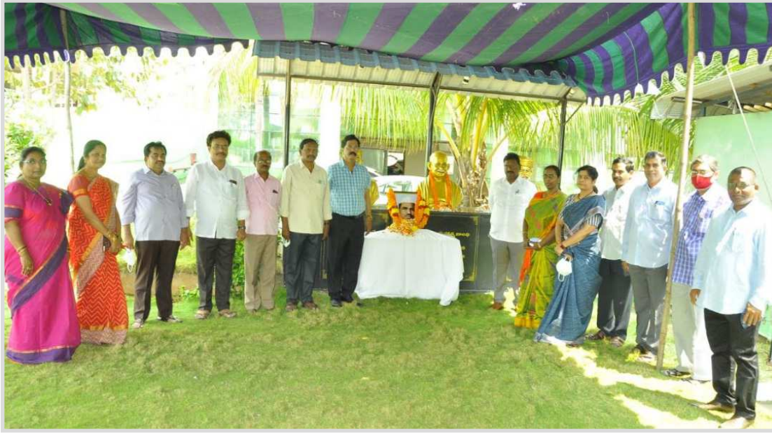
విశాఖపట్నం (విజయభాను న్యూస్) : ఆంధ్రప్రదేశ్ తూర్పు ప్రాంత విద్యుత్ పంపిణీ సంస్థలో బాబూ జగ్జీవన్ రామ్ 115వ జయంతి వేడుకలను సంస్థ సిబ్బంది ఘనంగా