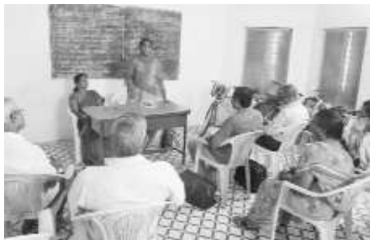
వైద్యుడికారణ ప్రమీల మాట్లాడుతూ నూలి పురుగుల నిర్మూలన దినం సందర్భంగా 1-18 సంవత్సరాల పిల్లలు అందరికీ నూలిపురుగుల నిర్మూలన మాత్రం నేడు ఉచితంగా అంగన్వాడీ కేంద్రాల్లో మరియు పాఠశాలల్లో అందజేస్తామని అన్నారు.

నమోదు చేయబడని మరియు పాఠశాలకు వెళ్ళని పిల్లలకు కూడా ఈ మందులను అందజేస్తామని ఆమె తెలిపారు. ఈ కార్యక్రమంలో పరవాడ మండల విద్యాశాఖాధికారిణి ఎమ్మెల్యే మరియు ప్రదా నోపాద్యాయులు తదితరులు పాల్గొన్నారు.