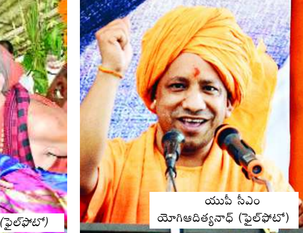
యూపీ సీఎం యోగిఆదిత్యనాథ్ (పైలఫోటో)