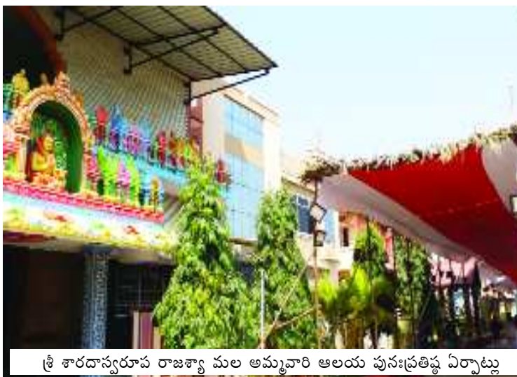
శ్రీ శారదాస్వరూప రాజస్వా మల అమ్మవారి ఆలయ పునఃప్రతిష్ఠ ఏర్పాట్లు