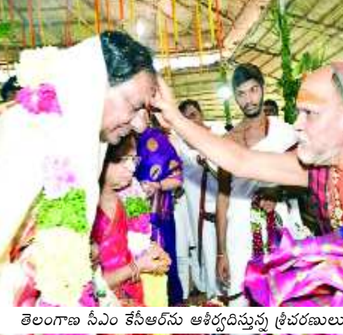
తెలంగాణ సీఎం కేసీఆర్ ను ఆశీర్వదిస్తున్న శ్రీచరణులు (పైలఫోటో)