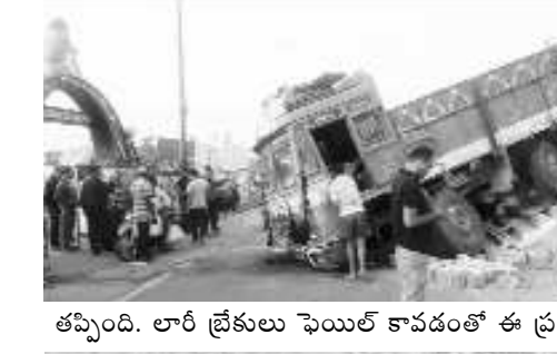
తప్పింది. లారీ డ్రైవరులు ఫెయిల్ కావడంతో ఈ ప్రమాదం జరిగినట్లు తెలిసింది.

విశాఖపట్నం: విశాఖ బీచ్ రోడ్డులో గురువారం తెల్లవారుజామున ఇసుక లారీ బీభత్సం సృష్టించింది. నోవాలెట్ జంక్షన్ వద్ద పందిమెట్ల రోడ్డు మీదుగా వచ్చిన ఇసుక లారీ బీచ్ రోడ్డులో సందర్భులు కూర్చునే గడను డీకాట్టింది. ఈ ప్రమాదంలో తెల్లవారుజామున జరగడంతో జనాలు ఎవరూ లేకపోవడంతో పెను ప్రమాదం తప్పింది.