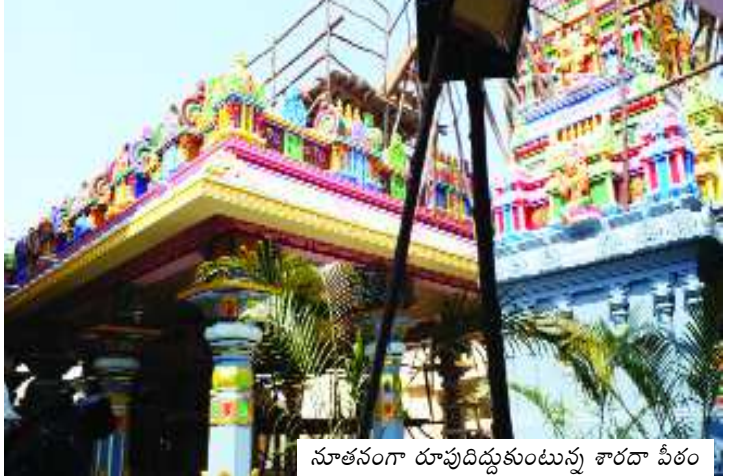
నూతనంగా రూపుదిద్దుకుంటున్న శారదా పీఠం