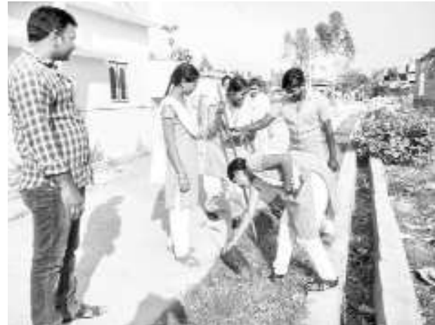
శ్రమదానం చేస్తున్న విద్యార్థులు

సర్వీసట్టం : స్వచ్ఛభారత్, స్వచ్ఛాంధ్రప్రదేశ్ లో భాగంగా సర్వీసట్టం ఏదిఎం కళాశాల ఎన్ఎస్ఎస్-