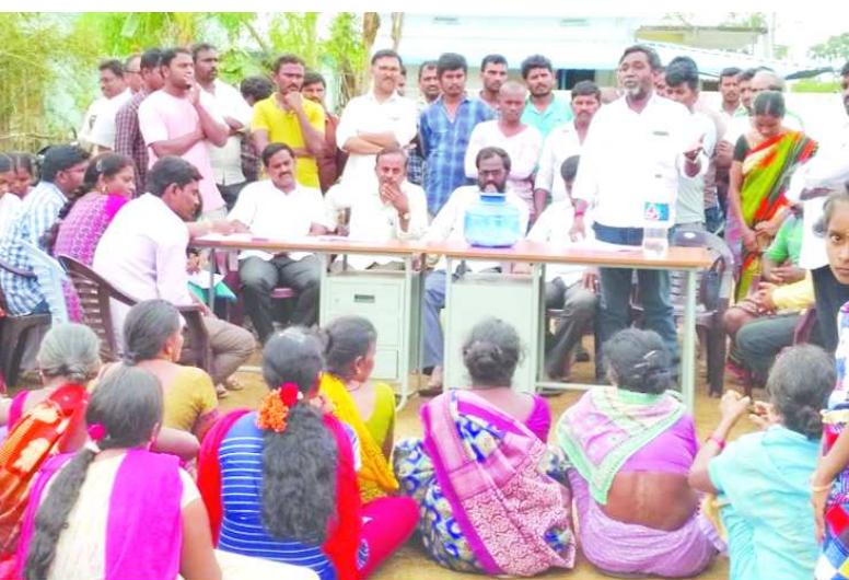
లబ్ధిదారుల సమక్షంలో లాటరీ తీస్తున్న రెవిన్యూ అధికారులు ప్రజాప్రతినిధులు

గొలుగొండ : శనివారం లింగం పేట, గుండపాల గ్రామాల్లో ప్రభుత్వం పంపిణీ చేస్తున్న ఇళ్ల స్థలాలకు సంబంధించి శనివారం వైసిపి నాయకులు, గ్రామ రెవెన్యూ అధికారులు ఆధ్వర్యంలో లబ్ధిదారులకు లాటరీ ద్వారా ఎంపిక చేయడం జరిగింది. లింగంపేటలో 32 మందికి, గుండపాల గ్రామంలో 48 మంది లబ్ధిదారులకు చెందిన ఇళ్ల స్థలాలకు లాటరీ నిర్వహించారు.