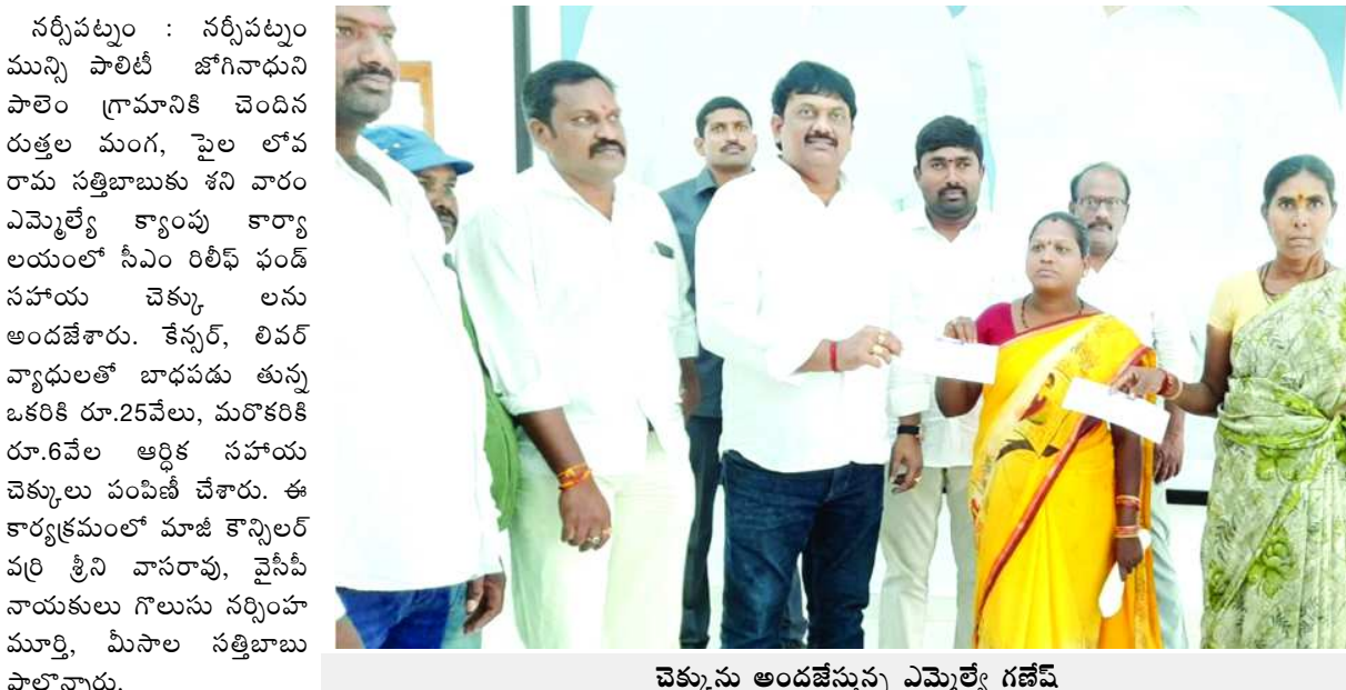
చెక్కును అందజేస్తున్న ఎమ్మెల్యే గజేష్